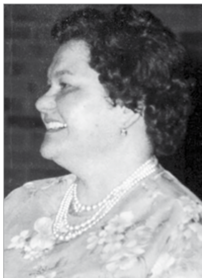
16 febbraio 2021