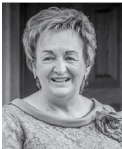
26 aprile 2026

In occasione del quinto anniversario della scomparsa la ricordano con amore e nostalgia il marito ed il figlio