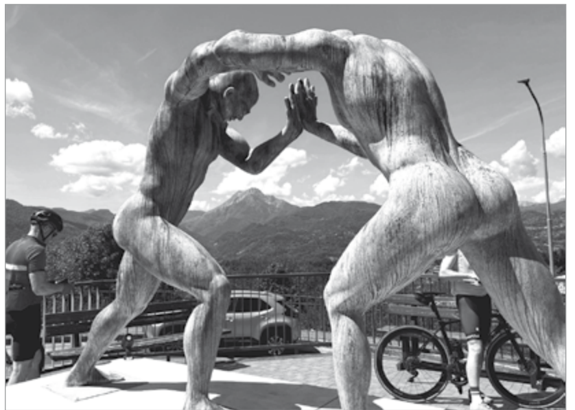
Altre opere nelle sedi dell'agenzia Unipol di Castelnuovo di Garfagnana e a Fornaci di Barga.