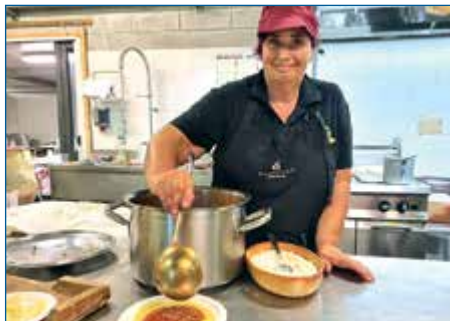
POLENTA E UCCELLI A FILECCHIO

Da sempre il menu, pur con qualche modifica, è prevalentemente a base di prodotti del maiale. Tutta roba locale e genuina, con tanti piatti a base di carne di maiale degli allevamenti dell'Arsenale. Le serate termineranno con il ballo all'aperto con orchestra. La sera del 27 speciale serata dance anni '90