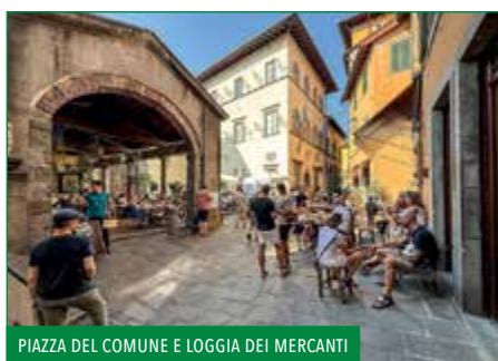
PIAZZA DEL COMUNE E LOGGIA DEI MERCANTI

Sono il cuore della vita del centro storico di Barga. Circondate da palazzi che ricordano il passato medico di Barga, qui si concentrano alcuni dei locali prediletti dai visitatori per un momento o per una serata di relax.