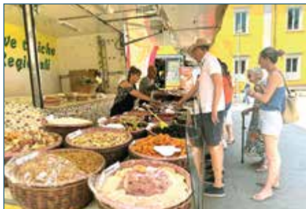
FIERA DI SANTA MARIA E DI SAN ROCCO