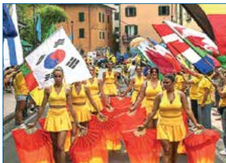
FESTA DEL MULETTO E DELLA CAMPAGNA

📅 5 e 12 giugno: Pop Up Exhibition - STAMPE BOTANICHE.