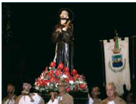
LA PROCESSIONE E IL PERDONO D'ASSISI

Il 2 agosto alle ore 11,15 l'eucaristia presieduta dal Vescovo di Pisa Mons. Saverio Cagninà che poi la sera alle 21 presiederà anche la tradizionale processione con la statua del santo portata in corteo lungo le strade vicine alla chiesa.