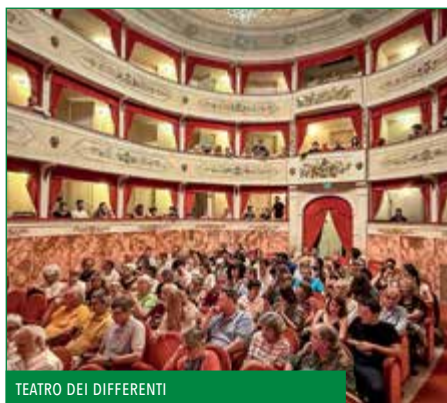
TEATRO DEI DIFFERENTI

Costruito nel 1795 su uno precedente del 1690. È uno dei piccoli teatri della Toscana di maggior pregio e meglio conservato. Ospita ogni anno una importante stagione di prosa ed il BargaJazz festival.