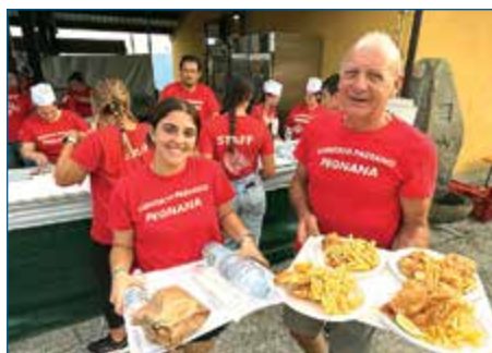
SAGRA DI PEGNANA