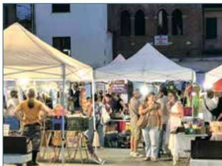
FIERA ESTIVA SOTTO LE STELLE