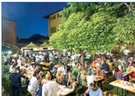
LE PIAZZETTE DI BARGA