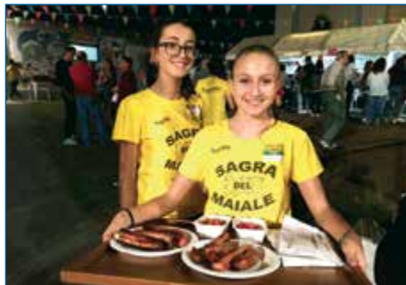
SAGRA DEL MAIALE