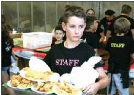
SAGRA DEL "FISH AND CHIPS"

Pegnana a Tutta Birra, serata dedicata ai giovani con gastronomia e musica con dj set.