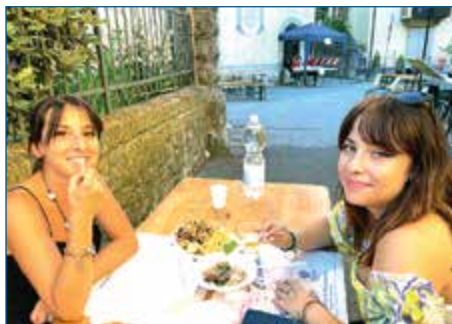
FESTA DELLA ROVELLA