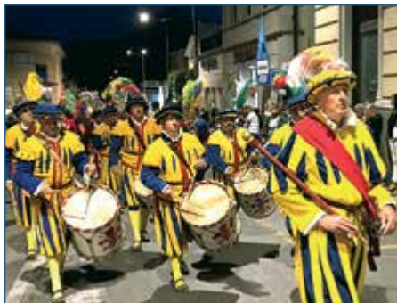
SAN CRISTOFORO A BARGA