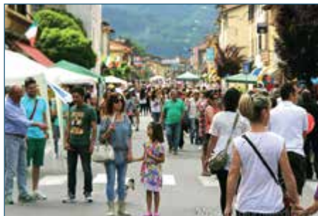
FIERA DEL 2 GIUGNO A FORNACI