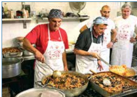
FESTA PAESANA – CENA SOTTO LE STELLE