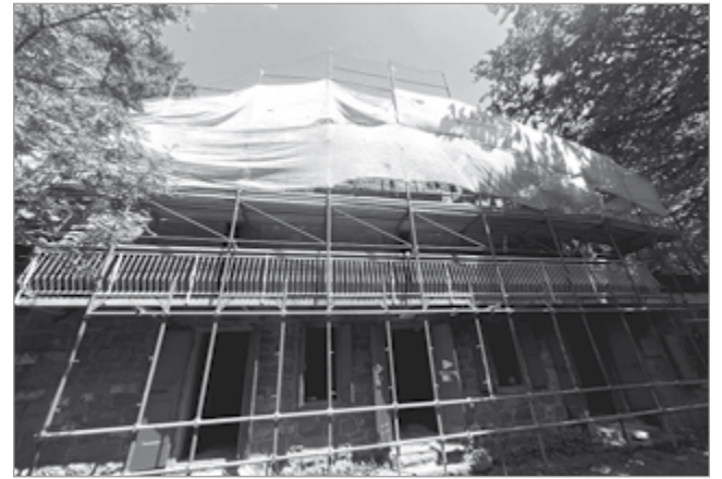
I lavori al Rifugio Marchetti

Il Comune di Barga è stato inoltre destinatario di un finanziamento di € 50.000 nel bando "Certificazione e mantenimento della certificazione di Gestione forestale sostenibile/responsabile" delle foreste del Demanio Civico di Barga. L'ASBUC ha presentato la propria offerta per realizzare il servizio previsto nella scheda di progetto ed è rima-