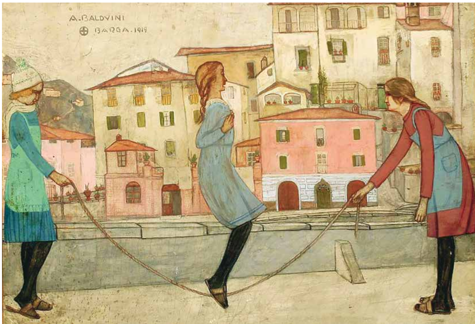
Aldolfo Balduini: Bambine che saltano la corda (1919, tempera su cartoncino preparato a gesso, cm 21 x 23)

BARGA – Inaugurata venerdì 11 luglio alla presenza di tante autorità e di tanti appassionati d'arte, è in corso "Barga incantata. Visioni del paesaggio dell'anima nell'arte di Alberto Magri, Adolfo Balduini, Bruno Cordati, Umberto Vittorini" che fino al 14 settembre sarà ospitata al Museo "Stanze della Memoria" di Barga. L'esposizione, mette insieme i quattro più significativi artisti barghigiani del '900, come non lo si faceva da una mostra che si tenne nel 1980.