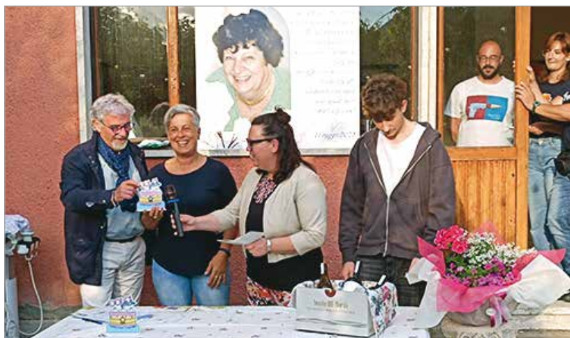
Uno dei momenti della premiazione

Il pomeriggio, con una bella partecipazione del paese, ha visto decretare anche i vincitori di una giuria popolare: primo premi per la