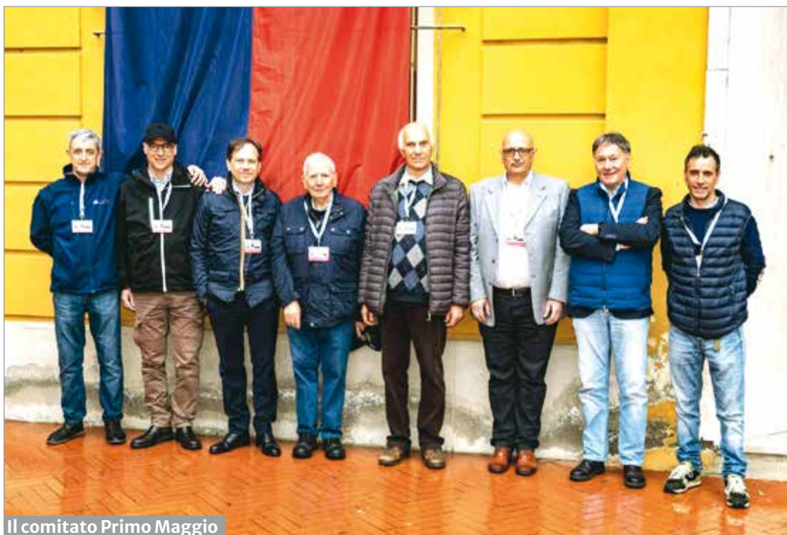
Il comitato Primo Maggio

Importante è anche il contributo di un'altra associazione di Volontariato che collabora con il Comitato 1° Maggio da molti anni, l'Associazione Nazionale Carabinieri in Congedo, che garantisce il servizio di prevenzione incendi e la gestione delle emergenze.