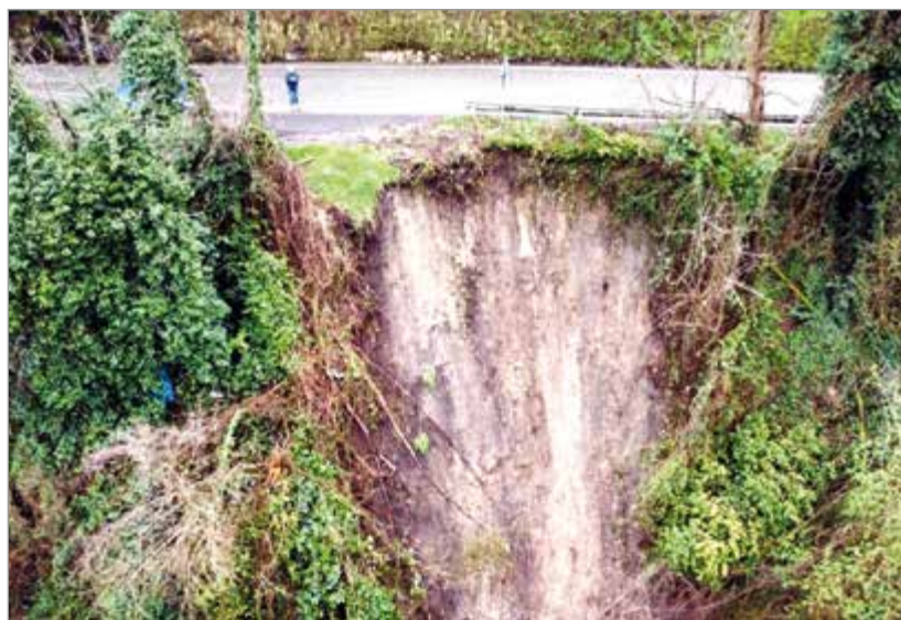
La frana a Ponte di Catagnana

Una grossa frana si è verificata anche a valle della SP 7 a Ponte di Catagnana. Anche qui un possibile intervento sarà alquanto importante, come spiegato dal consigliere provinciale Pietro Onesti con delega alla viabilità della Valle del Serchio, ma non esistono al momento pericoli per la strada.