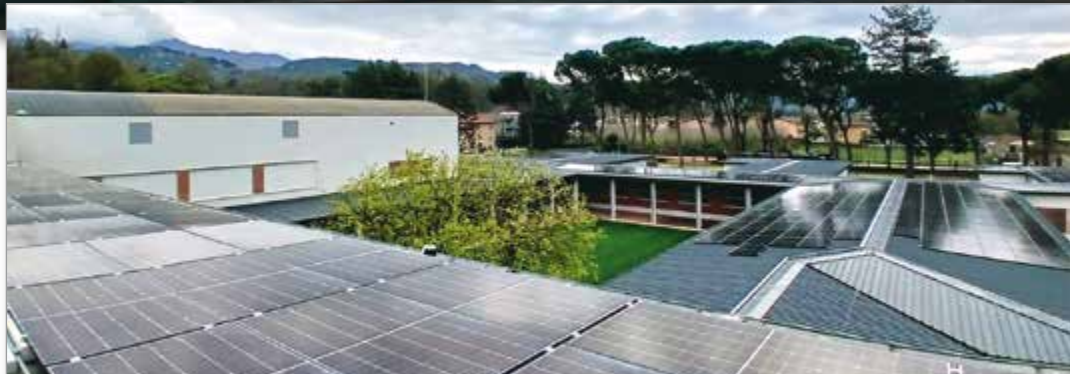
Tutto il Mudy è alimentato da pannelli solari. In basso, alcuni degli interni del museo