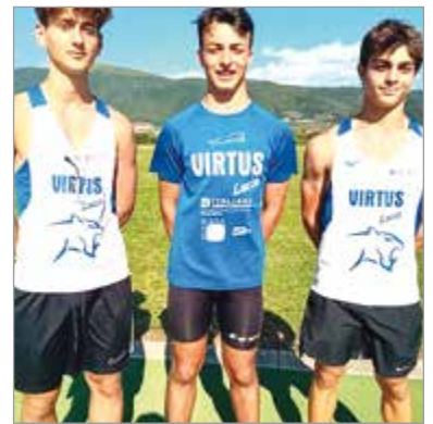
Nella foto, alcuni degli atleti barghigiani protagonisti dei successi di settembre