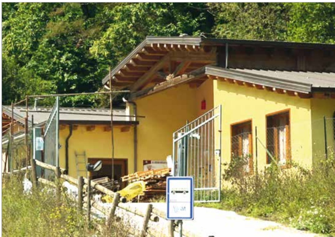
Una recente immagine della scuola di Fabbriche di Vallico

Prendiamo il percorso che in Turrtecava costeggia il lago, per un lungo tratto delimitato da un muro obsoleto, che al minimo urto potrebbe cedere. Poi, d'inverno, possono subentrare ghiaccio e neve, aggravando ancora di più la condizione della carreggiata. Da chi ha imposto o avallato la chiusura della scuola, è stato detto che gli alunni erano pochi ed il bilancio comunale non poteva sobbarcarsi di ulteriori spese. Ma i firmatari della lettera, ribattono che, in realtà, non ci sarebbe stato, come in questi casi si dovrebbe, un adeguato