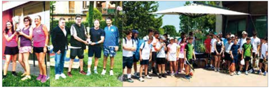
Da sinistra, la squadra DR24 Vamos di Ponte a Moriano, il Tweener Club Barga campione provinciale, i ragazzi del torneo ACS "Pinocchio con la Racchetta"

Successi anche per i più giovani: i ragazzi e le ragazze del Tweener