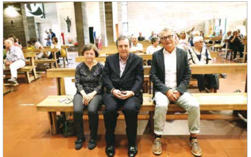
In alto, la messa celebrata dal cardinale Baldisseri; sotto, i tre ministri straordinari della comunione

Al termine della messa è stato recato in chiesa un quadro realizzato da Sandra Rigali con i ragazzi della terza media di Fornaci e il contributo della Villa di Riposo Pascoli di Barga dal titolo 100 volti: 100 volti che messi insieme formano il volto del mosaico della chiesa nuova di Fornaci. Dopo la messa il concerto del coro chiacchiere sonore, aperitivo in giardino con le famiglie e in serata la presentazione del libro su Fornaci di Sara Moscardini di cui parliamo in altra parte del giornale, oltre alla presentazione anche di una pubblicazione realizzata da don Giovanni e dedicata alla parrocchia.