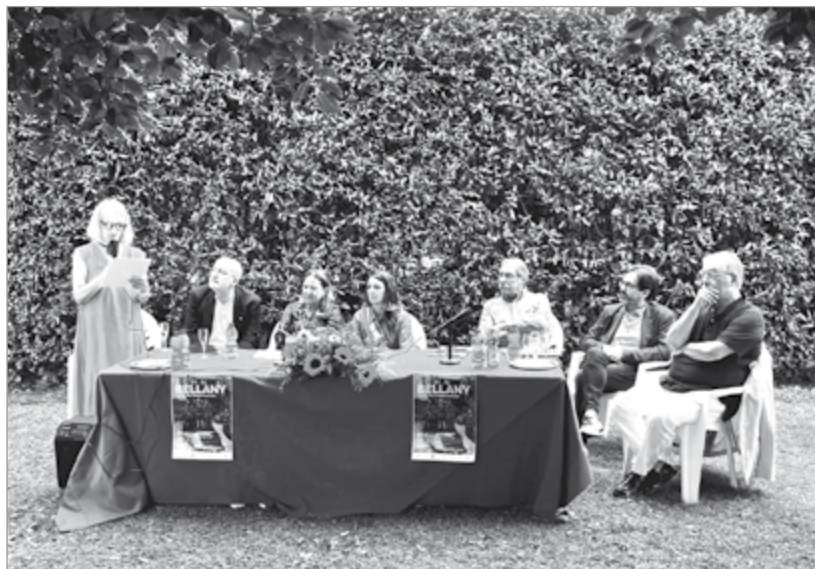
L'inaugurazione della mostra dedicata a Bellany alla Fondazione Ricci

Nel corso della mostra, la facciata del Teatro dei Differenti è stata interessata da una imponente installazione temporanea realizzata a partire dalle opere di Kracvzyna: una combinazione dell'iconico Castello di Barga con il personaggio di Icaro, più volte dipinto dall'artista.