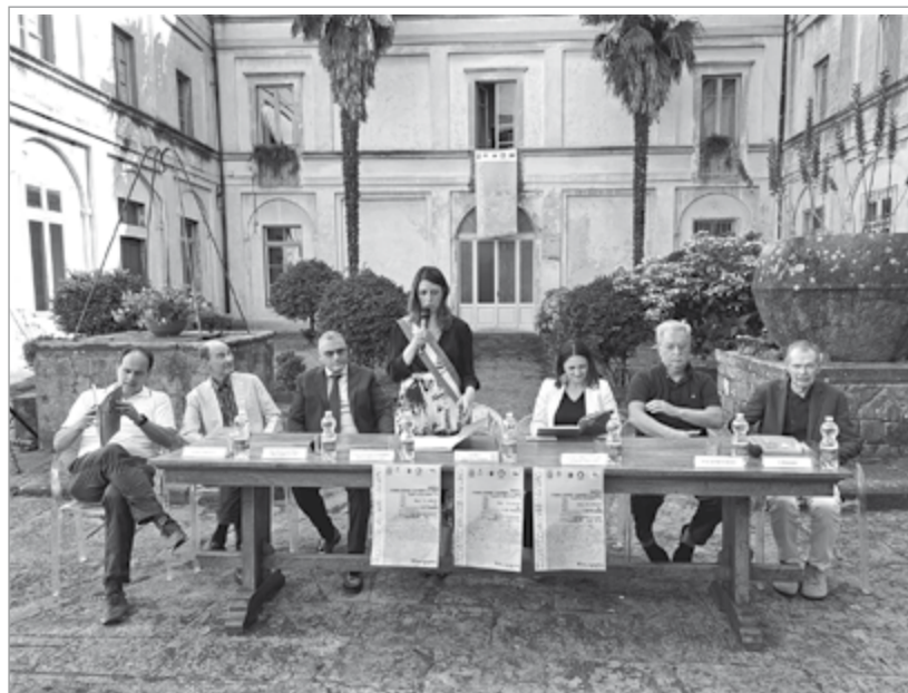
L'inaugurazione della mostra di Kracvzyna al Conservatorio S. Elisabetta

Prima di questa mostra, venerdì 30 giugno e fino alla metà di luglio, anche la Galleria Comunale ha aperto anche un'altra esposizione dedicata a Swietlan Kracvzyna e curata da Gianguido Grassi, Giorgia Madiari e Kerry Bell; alla scoperta della tecnica utilizzata da Kracvzyna nelle sue opere.