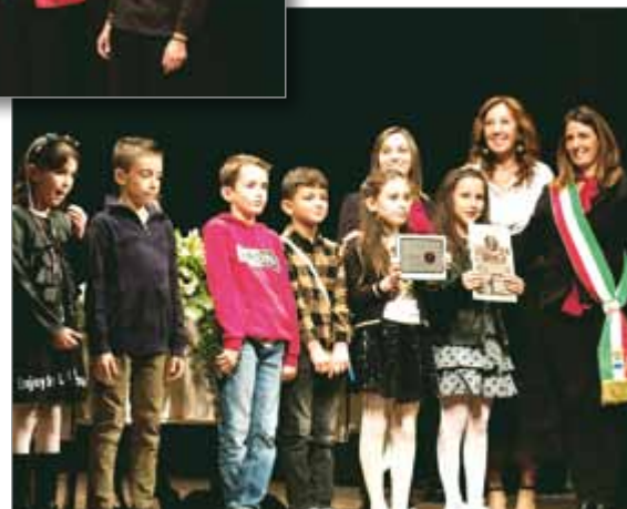
La premiazione della Classe 3A della Scuola Primaria di Fornaci di Barga