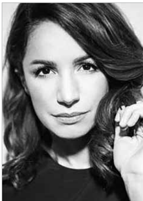
In alto, Giuseppe Battiston; a fianco, Andrea Delogu: due dei protagonisti della stagione di prosa al Teatro dei Differenti

Per informazioni: Ufficio Cultura (Via di Mezzo, 45 Barga). È possibile richiedere informazioni scrivendo a cultura@comunedibarga.it e/o telefonando ai numeri 0583 724791 - 0583 724727 dal lunedì al venerdì dalle 9.00 alle 13.00; martedì e giovedì anche il pomeriggio dalle 15.00 alle 17.00.