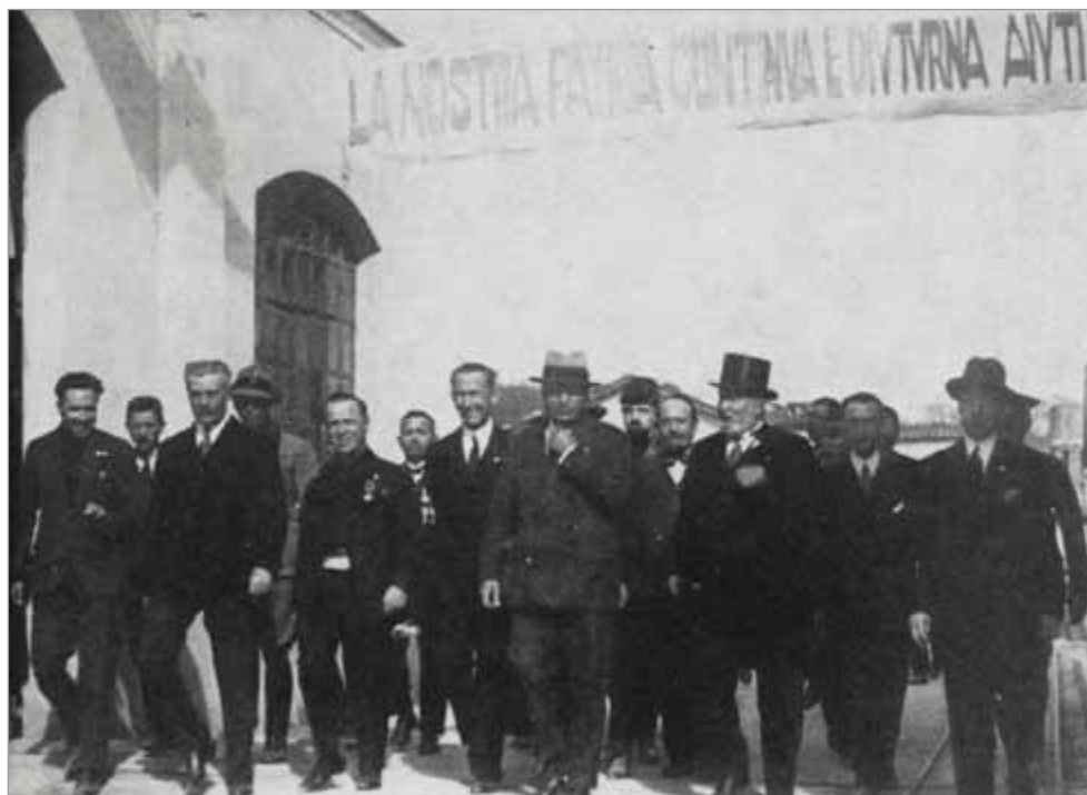
Benito Mussolini in visita alla S.M.I. di Fornaci nel 1930

Questi episodi e il clima nazionale tinteggiato dalla "paura rossa" spingevano comunque gran parte della popolazione del capoluogo a