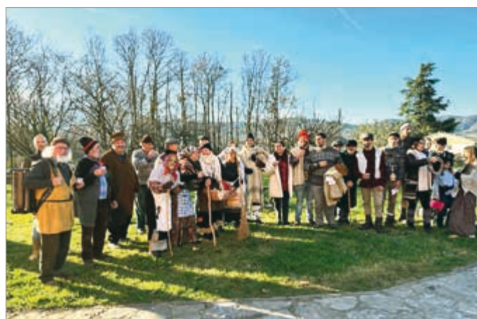
La Befana a San Pietro in Campo (sopra), a Castelvecchio (al centro) e Tiglio (a sinistra)