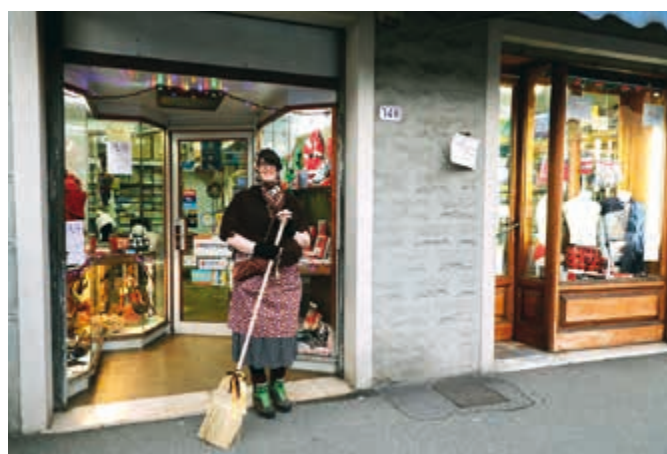
Il primo giorno di saldi a Fornaci