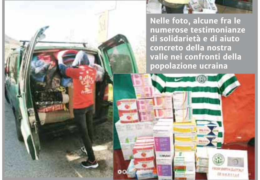
Nelle foto, alcune fra le numerose testimonianze di solidarietà e di aiuto concreto della nostra valle nei confronti della popolazione ucraina

All'iniziativa del Lions Club Garfagnana hanno dato notevole supporto anche altre realtà Lions. Il Distretto 108 prima di tutti, ma poi anche i club Lucca Host, Lucca le mura, Pontremoli e molti altri. Anche tante associazioni locali stanno facendo un gran lavoro.