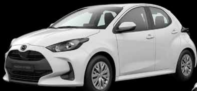
MAZDA 2 HYBRID

VIA DEL BRENNERO 996 - LUCCA TEL. 0583432543