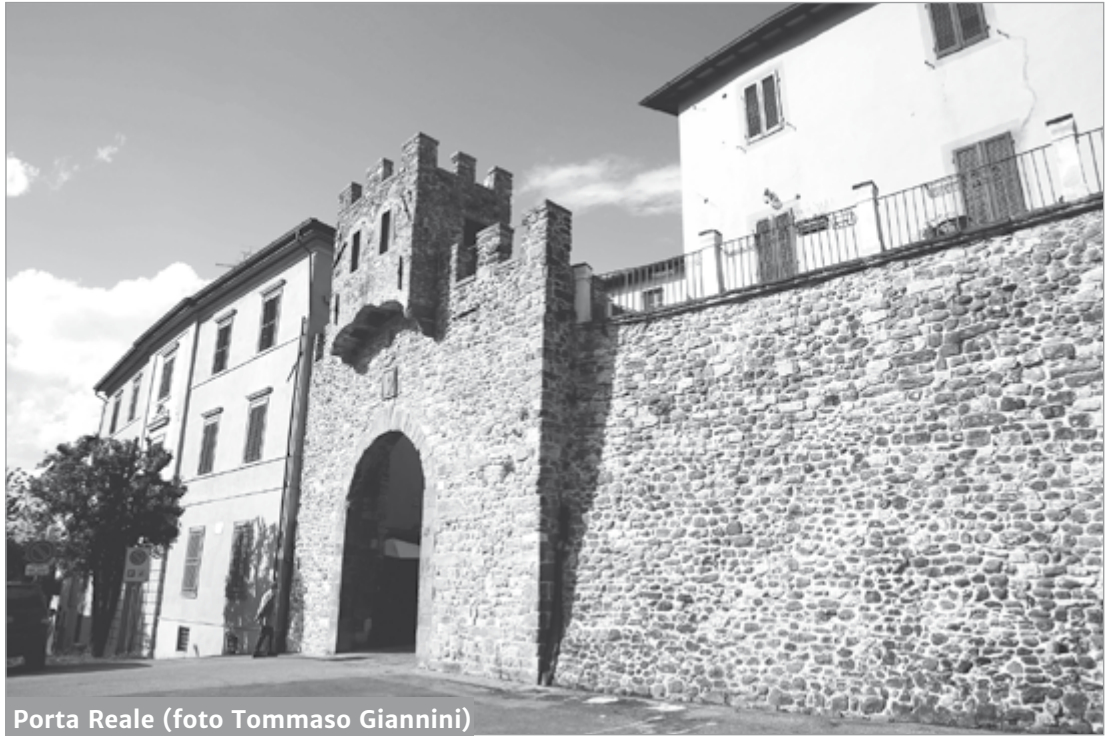
Porta Reale

Un incontro molto partecipato da abitanti ed operatori a dimostrazione della consapevolezza che indubbiamente questi luoghi saranno al centro della ripartenza. Ripartenza che vuol dire anche manifestazioni estive che, pur se con le limitazioni del caso, anche quest'anno, non mancheranno. Tra le iniziative l'evento Barga Live (le sere di musica e intrattenimento nel castello). Poi allo studio un inedito ed originale pacchetto musicale di concerti nella vastissima platea del piazzale del Fosso che, partendo dalla serata omaggio a Pascoli, potrebbe prevedere eventi anche fino al 12 agosto. Già definiti invece il programma del festival letterario Tra le righe di Barga