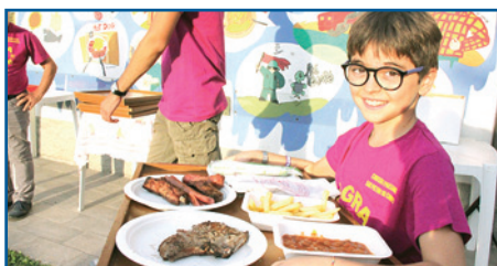
SOPRA, SAGRA IN PEGNANA; SOTTO, SAGRA DEL MAIALE

FISH AND CHIPS (pesce e patate) in omaggio alla tradizione della ristorazione dell'emigrazione barghigiana in Scozia. Il tutto presso lo stadio "Johnny Moscardini" di Barga organizzato dall'AS Barga. Nel primo fine settimana della prima decade di agosto a Barga c'è anche spazio per lo STREET FOOD FESTIVAL che si tiene in Piazza Pascoli con tanti "food truck" provenienti da diverse regioni.