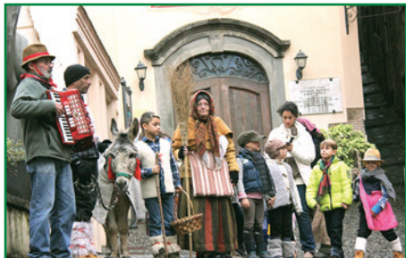
A FIANCO: I TRADIZIONALI CANTI DI QUESTUA PER LA BEFANA; SOTTO: TREKKING SULL'APPENNINO BARGHIGIANO; UNA IMMAGINE DELLA FESTA DELLE PIAZZETTE NEL CENTRO STORICO