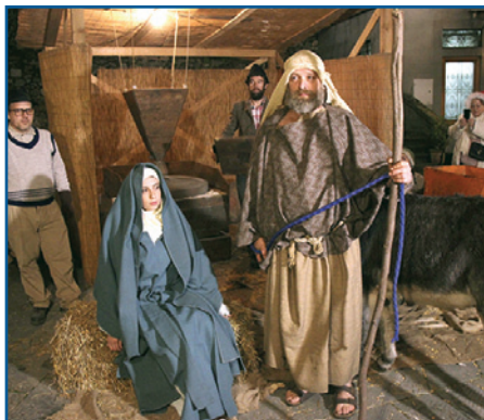
DALL'ALTO: SCOTTISH WEEK IN PIAZZA DEL COMUNE; BARGA CASTAGNA AL GIARDINO; IL PRESEPE VIVENTE IN DUOMO

IL PRESEPE VIVENTE - Il 23 dicembre da non perdere la tradizione e la spiritualità del Presepe Vivente, che si tiene nell'antico castello con la presenza di oltre 200 figuranti in costume e la rievocazione di numerosi antichi mestieri a fare da cornice al passaggio della sacra famiglia.