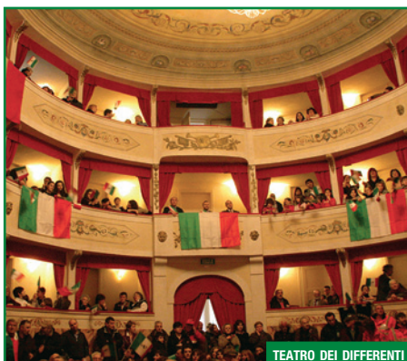
TEATRO DEI DIFFERENTI

Costruito nel 1795 su uno precedente del 1690. È uno dei piccoli teatri della Toscana di maggior pregio e meglio conservato. Ospita ogni anno una importante stagione di prosa ed i festival di Opera Barga e Barga Jazz.