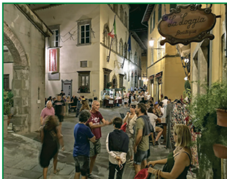
VILLA MOORINGS, UNA DELLE VILLE REALIZZATE DAGLI EMIGRANTI DI BARGA; REENACTORS DURANTE UNA COMMEMORAZIONE A SOMMOCOLONIA; UNA SERATA DI RELAX NEL CENTRO STORICO.