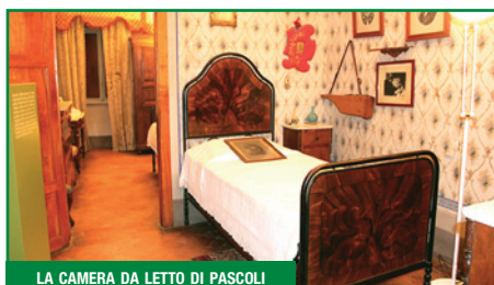
LA CAMERA DA LETTO DI PASCOLI