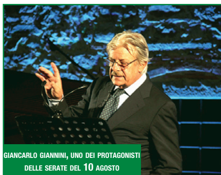
GIANCARLO GIANNINI, UNO DEI PROTAGONISTI DELLE SERATE DEL 10 AGOSTO