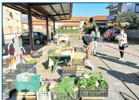
IN ALTO, MERCATO SOTTO LE STELLE; SOTTO, MERCATO CONTADINO

Per chi vuole fare la spesa settimanale di prodotti locali a Km 0 a Fornaci di Barga c'è il Mercato Contadino, un'ottima occasione per trovare alimenti di filiera corta, alla portata di tutti. Al mercato contadino è possibile trovare una gran varietà di prodotti provenienti da coltivazioni locali.