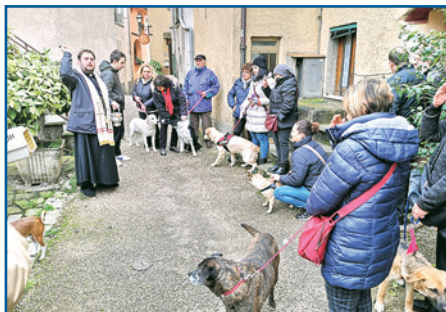
SANT'ANTONIO A FORNACI

Il 25 aprile a Tiglio si svolgono le rogazioni: sono delle suppliche, preghiere fatte con una certa decisione per invocare il buon raccolto nei campi e sono recitate in latino. Si chiede al Signore la protezione dei campi e del raccolto ma soprattutto di allontanare qualsiasi catastrofe