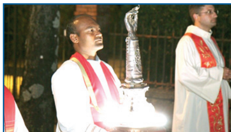
A SINISTRA, LA TREBBIATURA DEL GRANO; QUI SOPRA, TESTIMONIANZE DEL CULTO DI SAN CRISTOFORO A BARGA

È dal lontano 1522, un omaggio alla Compatrona barghigiana Madonna del Molino, che si tiene la tradizione del Doppio. Non è cosa da poco tirare le tre pesanti campane che portano con loro anche il peso di tanta storia: il primato spetta alla "Maria", la campana piccola del 1580, che nel 2020 suonerà il suo 440° doppio.