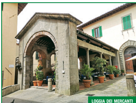
LOGGIA DEI MERCANTI

Sono il cuore della vita del centro storico di Barga. Circondate da palazzi che ricordano il passato medico di Barga, qui si concentrano alcuni dei locali prediletti dai visitatori per un momento e per una serata di relax.