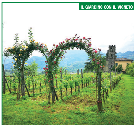
IL GIARDINO CON IL VIGNETO