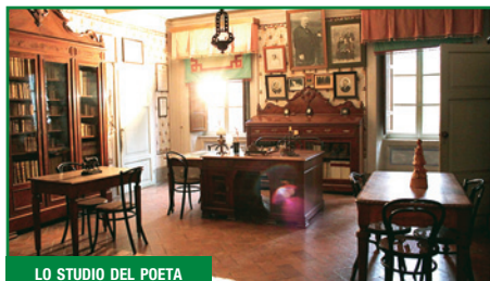
LO STUDIO DEL POETA