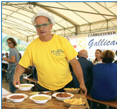
POLENTA E UCCELLI A FILECCHIO

San Pietro in campo, con il suo comitato vi aspetta negli ultimi due fine settimana di AGOSTO per l'antica SAGRA DEL MAIALE , presso il campi polivalenti del paese. A chiudere l'estate di sagre nel comune è solitamente quella della POLENTA E UCCELLI che nei primi tre fine settimana di SETTEMBRE viene organizzata a Filecchio dalla attiva Associazione dei Polentari. Nei mesi autunnali da non perdere gli appuntamenti con la MONDINATA DI MOLOGNO , solitamente nel fine settimana dopo la metà di OTTOBRE a Mologno e con la MONDINATA DI SOMMOCOLONIA che nel fine settimana dopo la metà di NOVEMBRE a Sommocolonia in occasione della ricorrenza di San Frediano.