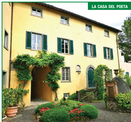
LA CASA DEL POETA