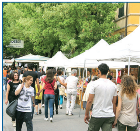
LA FIERA DEL 2 GIUGNO A FORNACI

La Festa della Repubblica a Fornaci è anche il compleanno del Centro Commerciale Naturale. Per questo motivo, a fianco delle celebrazioni istituzionali, si tengono in questa data anche iniziative commerciali e di intrattenimento. Tra queste un vasto e ricco mercato con più di 200 banchetti.