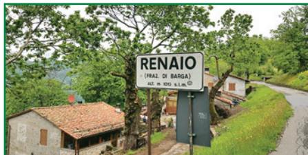
DALL'ALTO: FORNACI DI BARGA, CASTELVECCHIO PASCOLI, SOMMOCOLONIA, RENAI