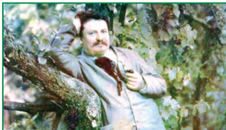
SOPRA LA FACCIATA DEL DUOMO; A FIANCO: IL PULPITO MARMOREO DI SCUOLA ROMANICA (SEC. XIII); GIOVANNI PASCOLI NEL SUO GIARDINO NELLA DIMORA DI CASTELVECCHIO