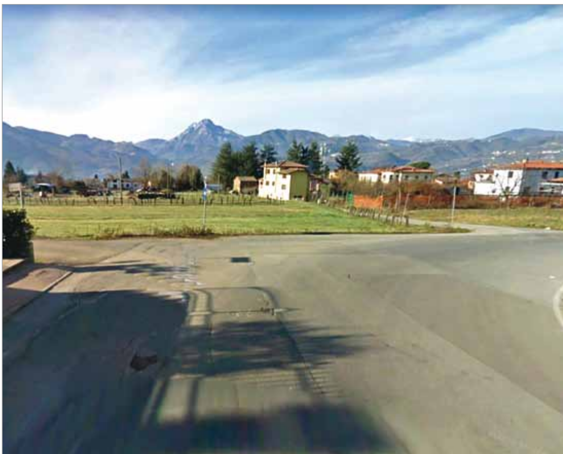
Il punto dove deve sorgere la rotonda di Via Puccini

Per quanto riguarda Ponte all'Ania è stato anche in questo caso approvato dalla giunta il progetto definitivo per la richiesta di finanziamento regionale, sempre nel medesimo bando. Il lavoro costerebbe 150 mila euro, con una quota parte del comune, in caso di accettazione dell'intervento dalla Regione, di 30 mila euro.