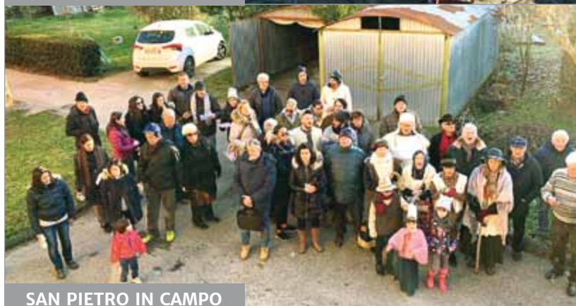
SAN PIETRO IN CAMPO