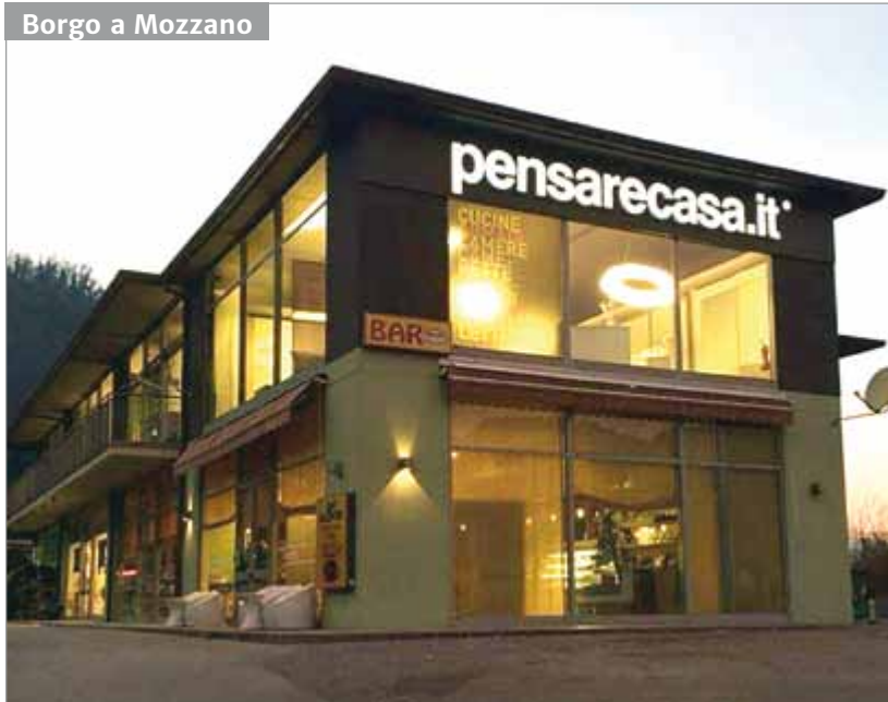
Borgio a Mozzano

Qui, a Pensarecasa.it, si fa tutto su progettazione; si realizza il tutto dopo uno scrupoloso rilievo delle vostre stanze ed un'altrettanta scrupolosa elaborazione che non vi costeranno nemmeno una lira. Qui troverete gente seria che vi seguirà in tutte le fasi del pre-vendita e del postvendita, dal prendere le misure fino all'assistenza a lavoro finito per qualsiasi vostra ulteriore esigenza.