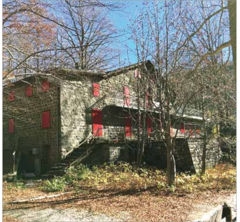
Il rifugio Marchetti al Lago Santo

"ASBUC ha sempre dimostrato - prosegue Feniello - la volontà di riprendere l'attività del Rifugio Marchetti a mezzo di gestore serio e locale. Ha intrapreso ogni possibile, proficuo contatto con tutte le realtà territoriali e, in particolare, con la locale Amministrazione. Purtroppo, la ripresa dell'attività del Rifugio Marchetti è stata impedita per anni ed è tuttora impedita dall'imponente contenzioso intrapreso dal vecchio gestore e che non si è ancora concluso e ASBUC non è in condizione, non solo di far riprendere l'attività del Rifugio, ma anche di compiere quegli interventi di manutenzione che la trascuratezza e gli inadempimenti di chi l'ha occupato anche quando non aveva più alcun titolo hanno reso inevitabili".