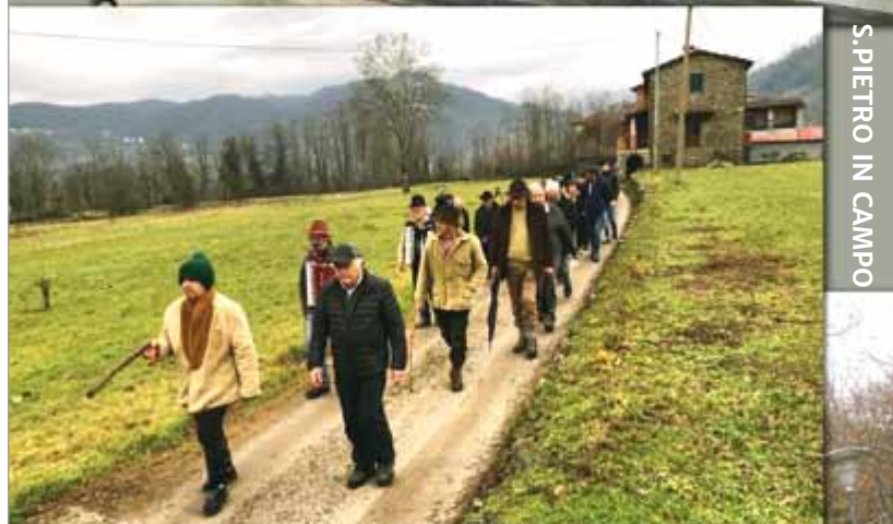
S. PIETRO IN CAMPO