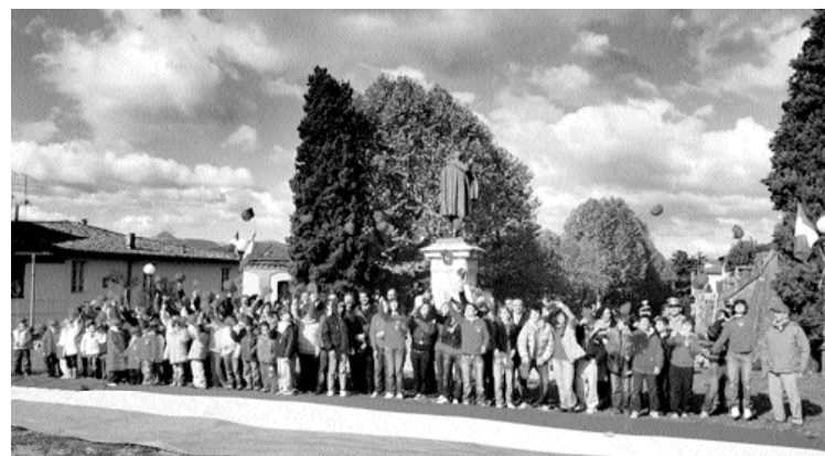
Tutti insieme sul bastione per l'omaggio a Giuseppe Garibaldi

La giornata si è conclu- sa a Castelvecchio, dove al ricordo di Garibaldi si è unito quello di Giovanni Pascoli e dove le iniziative proposte sono state davve- ro tante. Tra queste l'in- contro sul tema "Giovanni Pascoli e Plinio Nomellini. Un poeta e un pittore nel nome di Garibaldi", asso- ciato anche ad una mo- stra. Tanta la gente che ha preso parte all'evento an- che il pomeriggio.