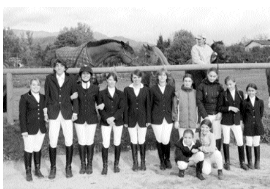
Nella foto di Borghesi i cavalieri del Club Ippico di Barga.