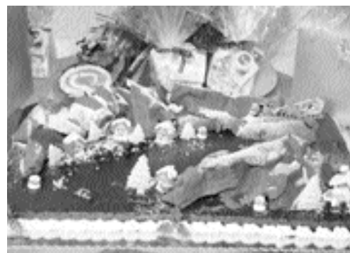
Una creazione cioccolatiera della pasticceria De Servi di Fornaci, esposta nella precedente edi- zione.