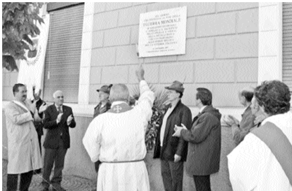
L'inaugurazione della lapide posta presso lo stabilimento KME

Domenica 4 novembre un ricordo è andato anche a tutti i caduti con la deposizione di corone ai monumenti a Barga, Fornaci, Filecchio, Pedonana. A Ponte all'Ania sono stati ricordati anche ai Martiri delle Foibe con una cerimonia nel nuovo Largo Ridano Danilo Marsigli.