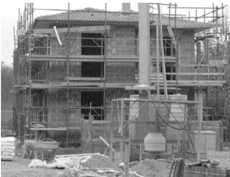
Nuove abitazioni sorgeranno nel Comune di Barga