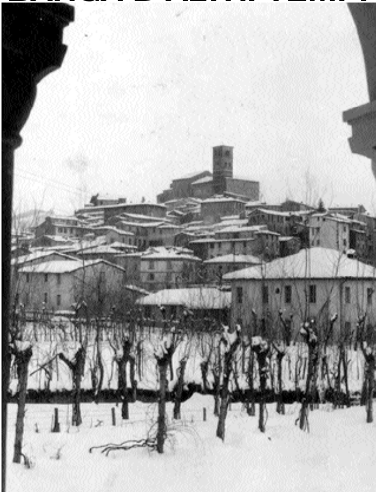
Una veduta di Barga con la neve della prima metà del secolo scorso.

di Barga e Castelnuovo. Gli appuntamenti per esami tipo elettrocardiogramma ed ecografia, ci dice Da Prato dopo averlo sperimentato su se stesso, richiedono tempi molto lunghi, anche di tre mesi; sia a Barga che a Castelnuovo. Mentre se ci si sposta a Lucca i tempi sono di molto inferiori ed in alcuni casi quasi immediati, nel caso si venga sottoposti agli esami nelle case di cura e nei centri convenzionati.