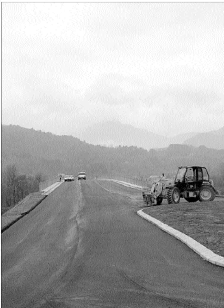
Una recente immagine dei lavori al Ponte sul Serchio