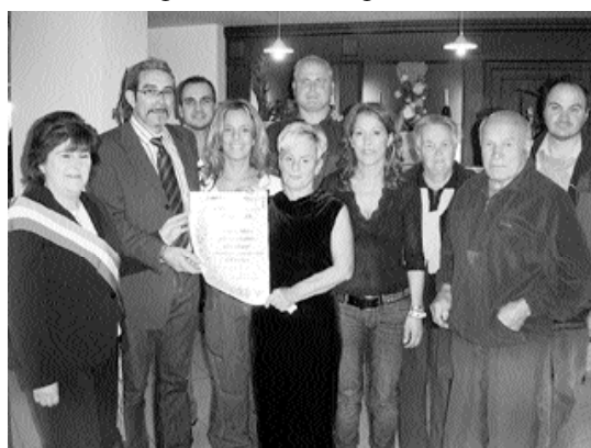
Nella foto le tre titolari con le autorità ed i propri collaboratori, il giorno dell'inaugurazione