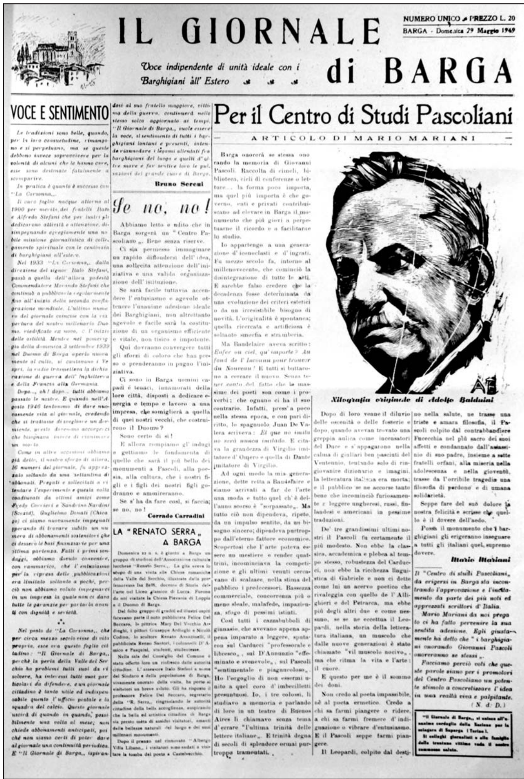
La prima pagina del primo numero del Giornale di Barga pubblicato il 29 maggio del 1949

WWW.GIORNALEDIBARGA.IT Le notizie in tempo reale della tua comunità