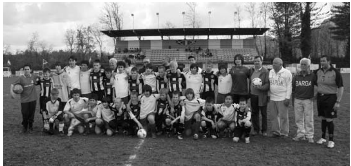
Foto ricordo dei calciatori scozzesi e barghigiani allo stadio "Moscardini"

I ragazzi hanno disputato due incontri: venerdì 17 aprile contro la squadra dell'US Fornaci e lunedì 20 aprile contro l'AS Barga. Durante la permanenza c'è stato anche un incontro ufficiale a Palazzo Pancrazi con il sindaco, Umberto Sereni, per il consueto scambio di doni.