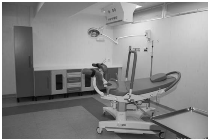
Un'immagine della nuove sale parto