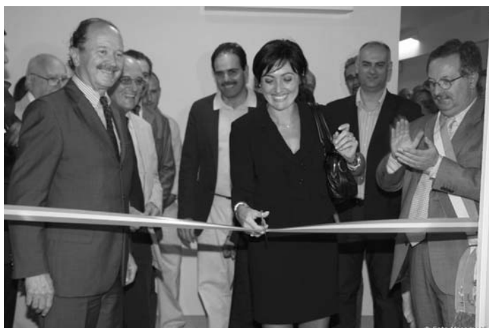
L'inaugurazione delle nuove sale