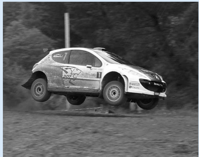
Lo show del mitico "Ucci"

CASTELVECCHIO PASCOLI - Ottima riuscita per l'attesa seconda edizione del "Paolo Andreucci Rally Show", l'esibizione che il 6 giugno è andata in scena sui percorsi sterrati de "Il Ciocco Hotels & Resort" di Castelvecchio Pascoli.