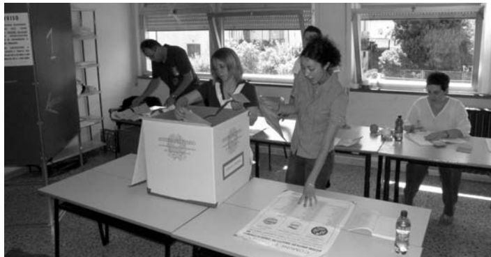
Un momento delle operazioni di scrutinio a Barga.