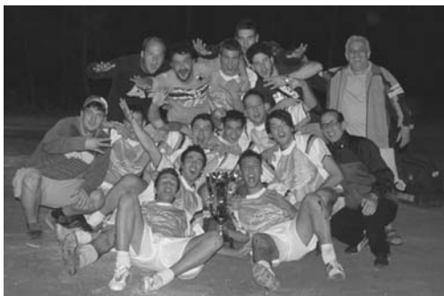
La squadra della trattoria da Riccardo

Per quanto riguarda il torneo del Cancellone under 40 le altre due finaliste per il I e II posto a scendere in cam-