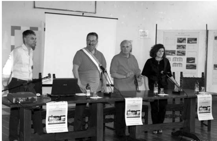
Un momento della presentazione del progetto