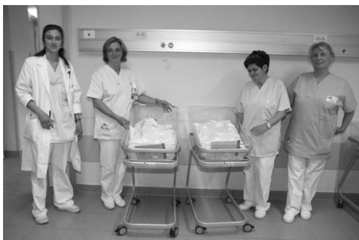
I nuovi lettini in cui sono ospitati i neonati