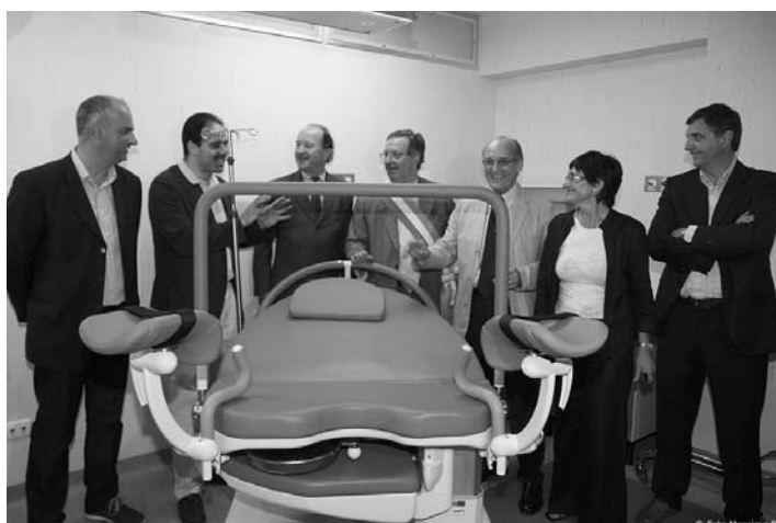
Le autorità in visita nella nuova sala parto