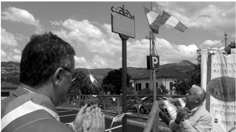
Un momento dell'intitolazione del parcheggio