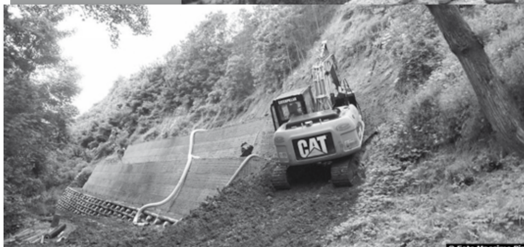
A sinistra, i lavori sul versante del Rio Fontanamaggio a Barga