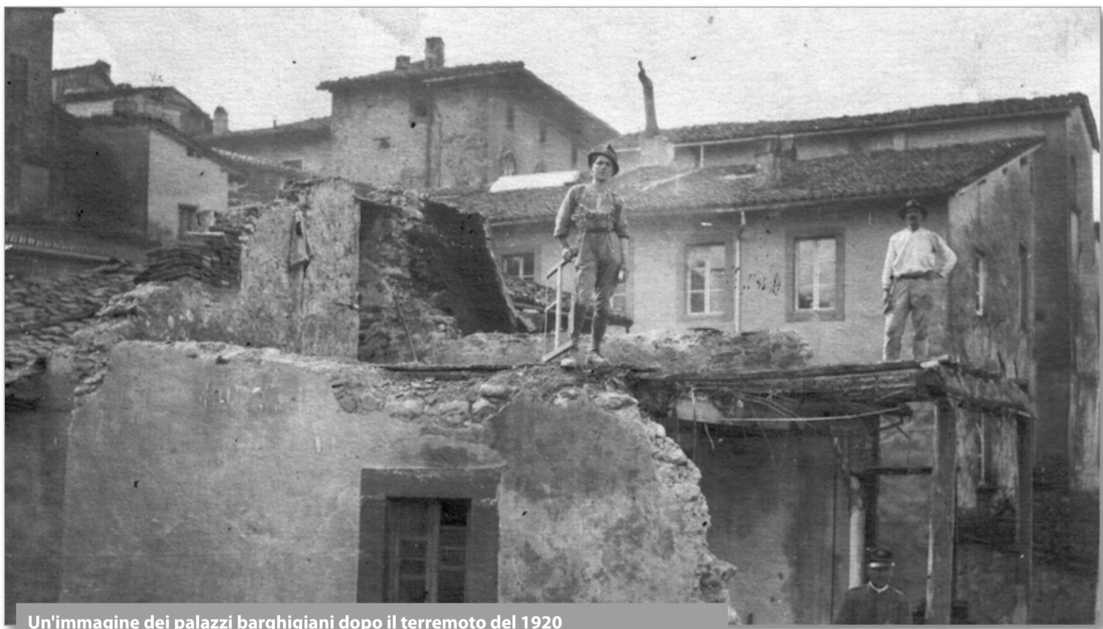
Un'immagine dei palazzi barghigiani dopo il terremoto del 1920

Quello che si sa della pericolosità sismica è che il terremoto storicamente ritorna ed il modo e la maniera per difendersi sono l'applicazione del-