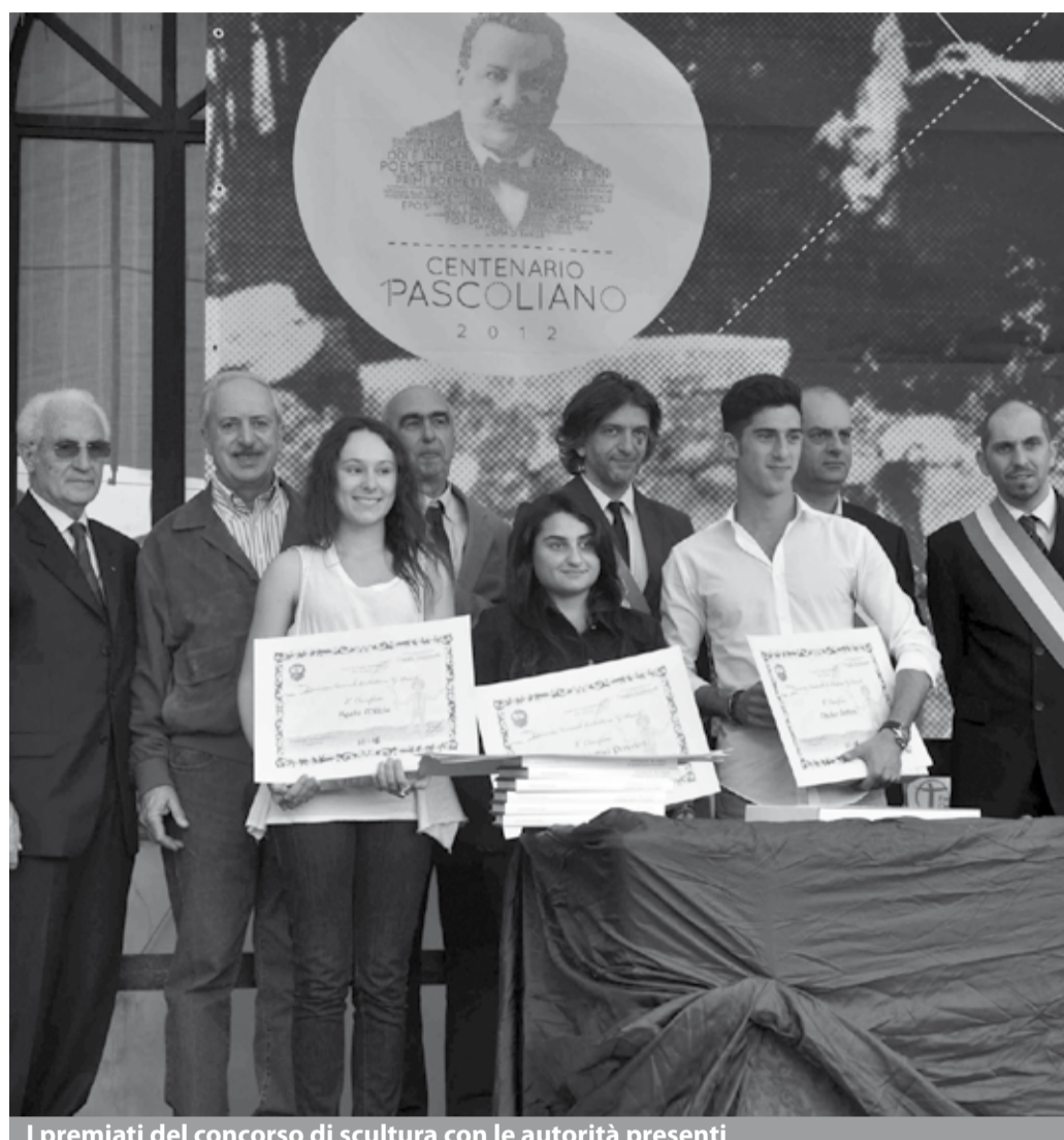
I premiati del concorso di scultura con le autorità presenti

COREGLIA – Centinaia di adesioni provenienti da licei e istituti d'arte della Penisola: è stato un vero successo il concorso di scultura dedicato a Giovanni Pascoli, nel centenario della morte del poeta, organizzato dal Comune di Coreglia Antelminelli, ente capofila del Sistema Museale della Valle del Serchio.