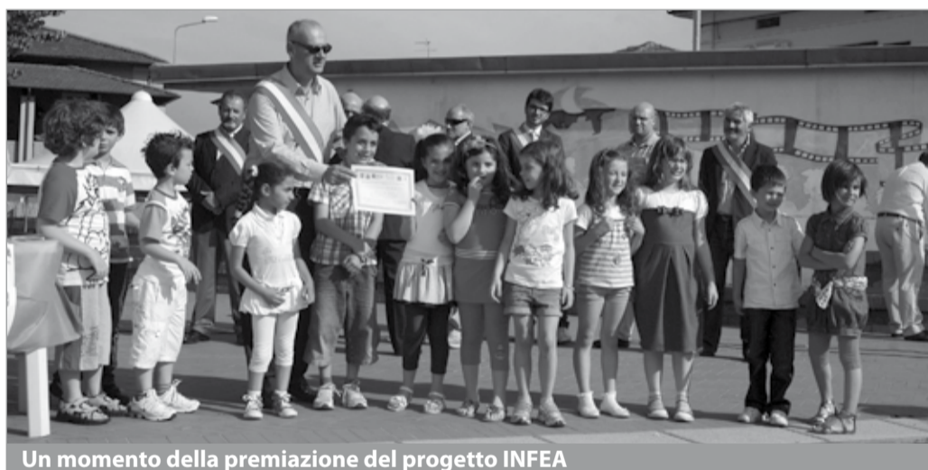
Un momento della premiazione del progetto INFEA

Il 2 giugno ha segnato anche l'avvio dell'iniziativa "Operazione Riciclo", un'idea del Centro Commerciale Naturale che rimarrà attiva per i prossimi mesi e che prevede il ritiro di merci usate in cambio di buoni sconto. Per saperne di più, visitate i negozi che espongono in vetrina il manifesto dell'iniziativa.