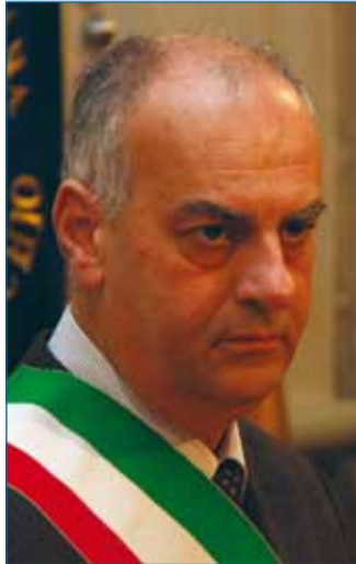
INTERVISTA AL SINDACO A PAGINA 6

Un servizio in più per aiutare i cittadini alle prese con questa imposta.