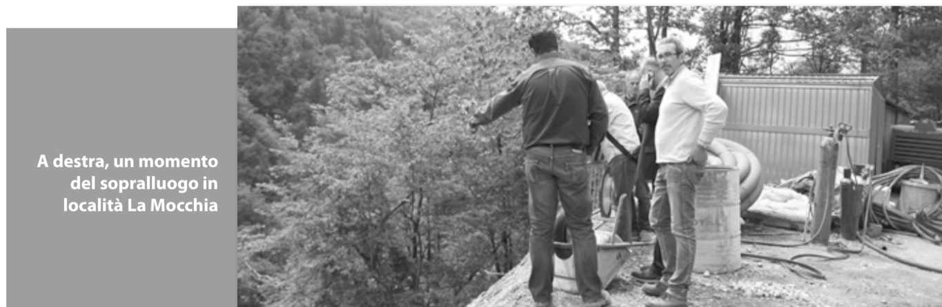
A destra, un momento del sopralluogo in località La Mocchia

Recentemente, sono stati anche conclusi i lavori per la messa in sicurezza della strada di Albiano interessata da una frana e presso la strada di Buvicchia a Barga, interessata da due ampie frane. In totale sono stati investiti in questi lavori circa 150mila euro.