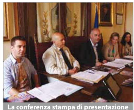
La conferenza stampa di presentazione

Non è stato facile mettere in piedi questa IV edizione a causa della ristrettezza di fondi economici legata alla difficile situazione generale, ma il concorso, segno tangibile della sua crescente apprezzamento nel territorio, ha ottenuto fortunatamente l'importante appoggio di alcune realtà locali che hanno permesso di mettere insieme anche il ricco montepremi che prevede 2 mila euro in borse di studio finalizzate a sostenere un percorso di perfezionamento musicale dei vincitori.