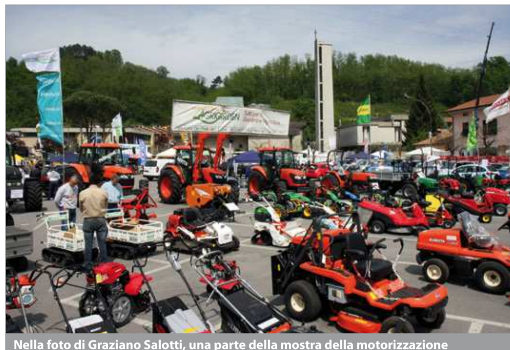
Nella foto di Graziano Salotti, una parte della mostra della motorizzazione