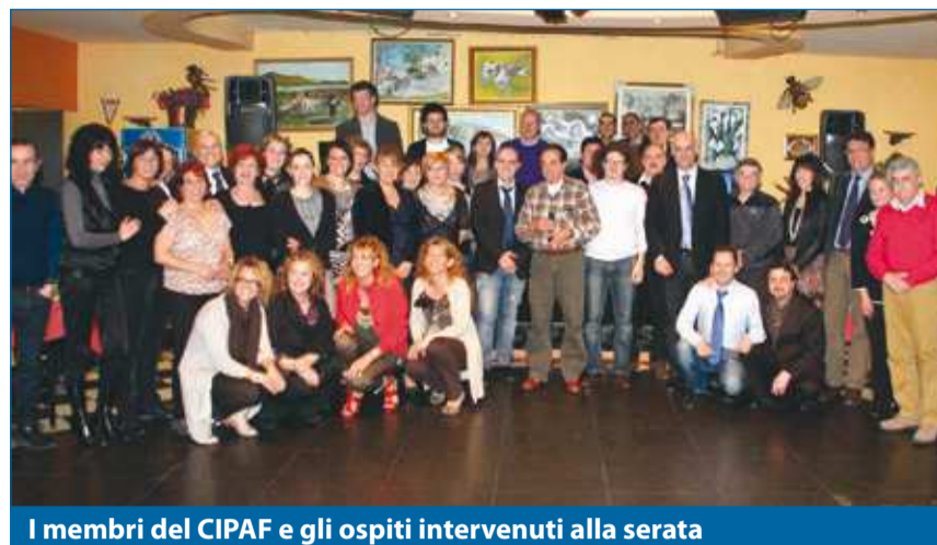
I membri del CIPAF e gli ospiti intervenuti alla serata

FORNACI – Più di cento persone hanno preso parte lo scorso 25 marzo alla festa per il venticinquesimo anno di vita del CIPAF, il comitato che raccoglie commercianti, industriali, professionisti e artigiani fornacini.