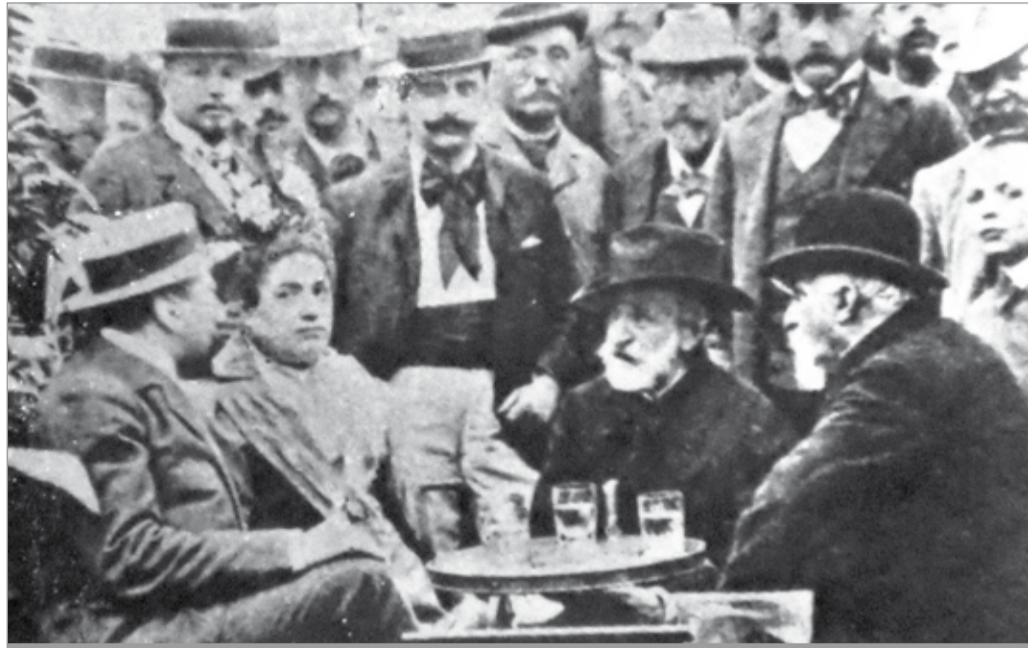
Antonio Mordini e Giuseppe Verdi ai Bagni di Montecatini

Un'amicizia patriottica ai Bagni di Montecatini. Questo in sintesi lo scambievolmente intercorso tra due eminenti figure del nostro Risorgimento, che sul finire del sec. XIX, nella verde Valdinievole, vissero momenti di sana celebrazione spirituale: Giuseppe Verdi (1813-1901) e Antonio Mordini (1819-1902).