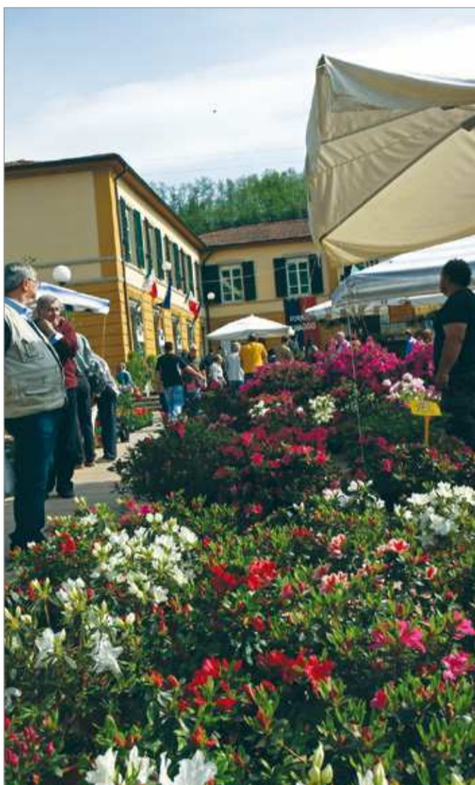
Piazza IV novembre fiorita