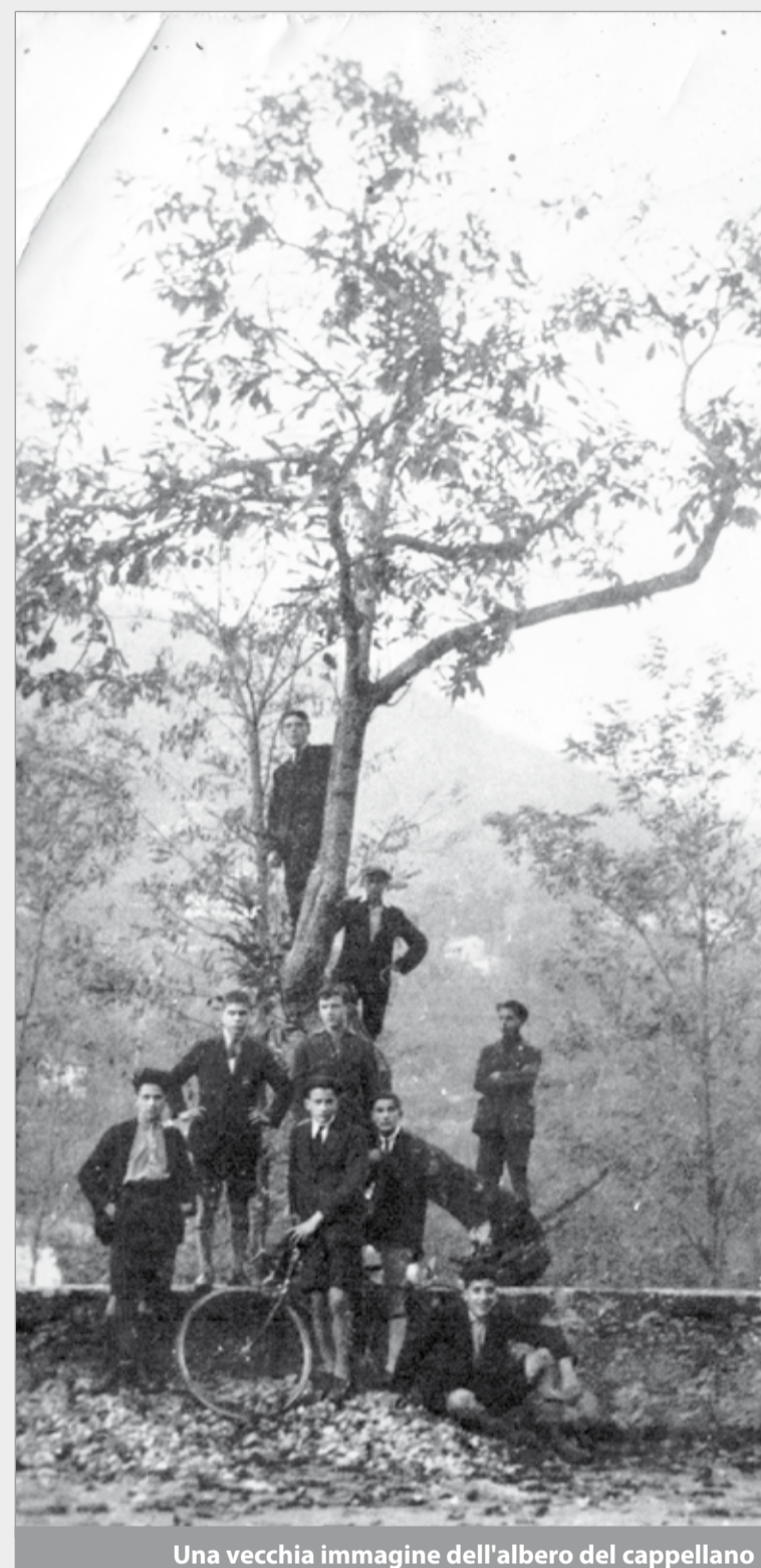
Una vecchia immagine dell'albero del cappellano