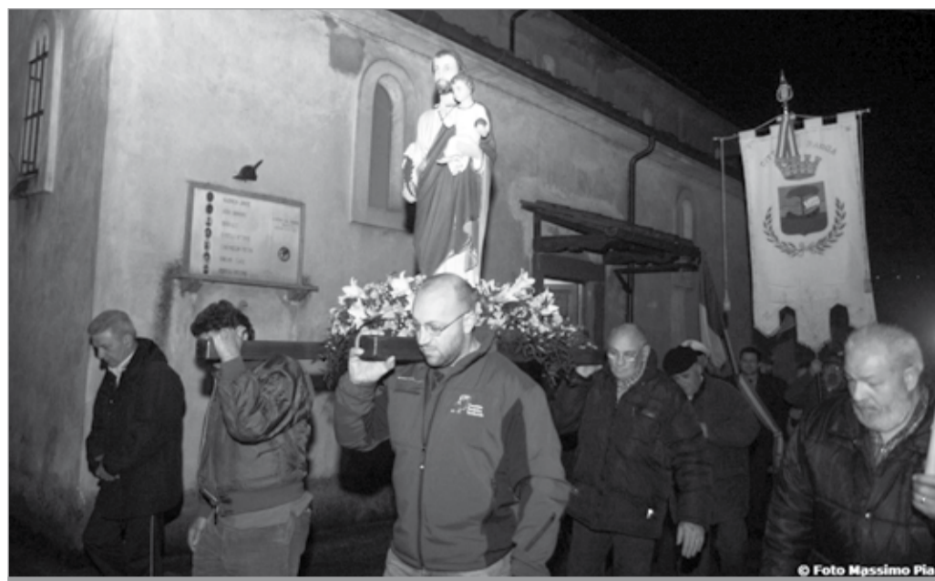
La statua di San Giuseppe portata in processione

La sera del 19 è stata più all'insegna del "profano", con la cena organizzata nei locali parrocchiali per festeggiare il neo