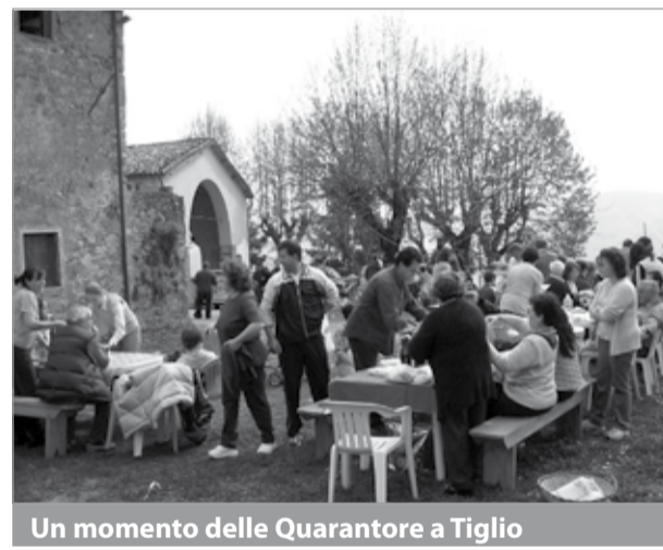
Un momento delle Quarantore a Tiglio

TIGLIO - Come ogni anno nel paese verranno festeggiate le Quarantore in occasione della Santa Pasqua. Tra la domenica, il lunedì dell'Angelo e martedì, molti fedeli raggiungeranno la Chiesa di San Giusto con la volontà ed il desiderio di pregare Cristo e la SS. Annunziata.