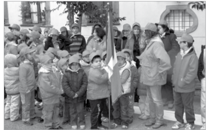
Un momento delle celebrazioni garibaldine tenutesi a Barga nel 2007 con i ragazzi delle scuole

Antonio Nardini Istituto Storico Lucchese