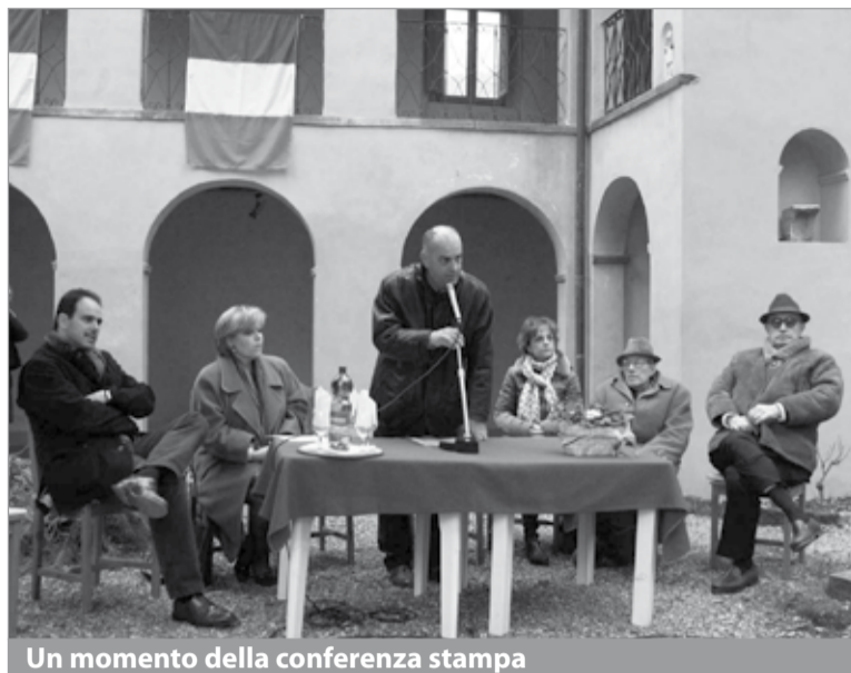
Un momento della conferenza stampa

TANTE INIZIATIVE PER LA COMMISSIONE PARI OPPORTUNITÀ