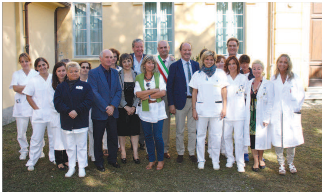
Le autorità con il personale del centro riabilitativo territoriale

FORNACI – Il centro riabilitativo territoriale, ristrutturato in questi mesi nell'ambito di un intervento complessivo sui locali del CESER e costato circa 980 mila euro, è adesso più funzionale e rispondente alle esigenze dei pazienti e degli operatori sanitari. L'inaugurazione è avvenuta lo scorso 4 ottobre.