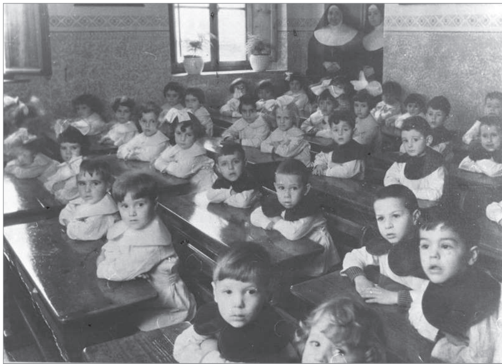
I bambini dell'Asilo Donnini nell'anno scolastico 1934-35.