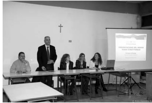
Uno degli incontri di presentazione del piano strutturale