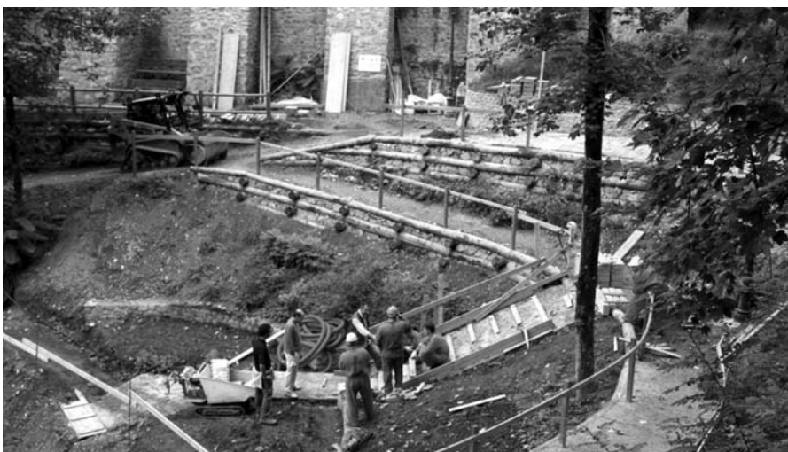
Un'immagine dei lavori in corso per la messa in sicurezza del rio Fontanamaggio