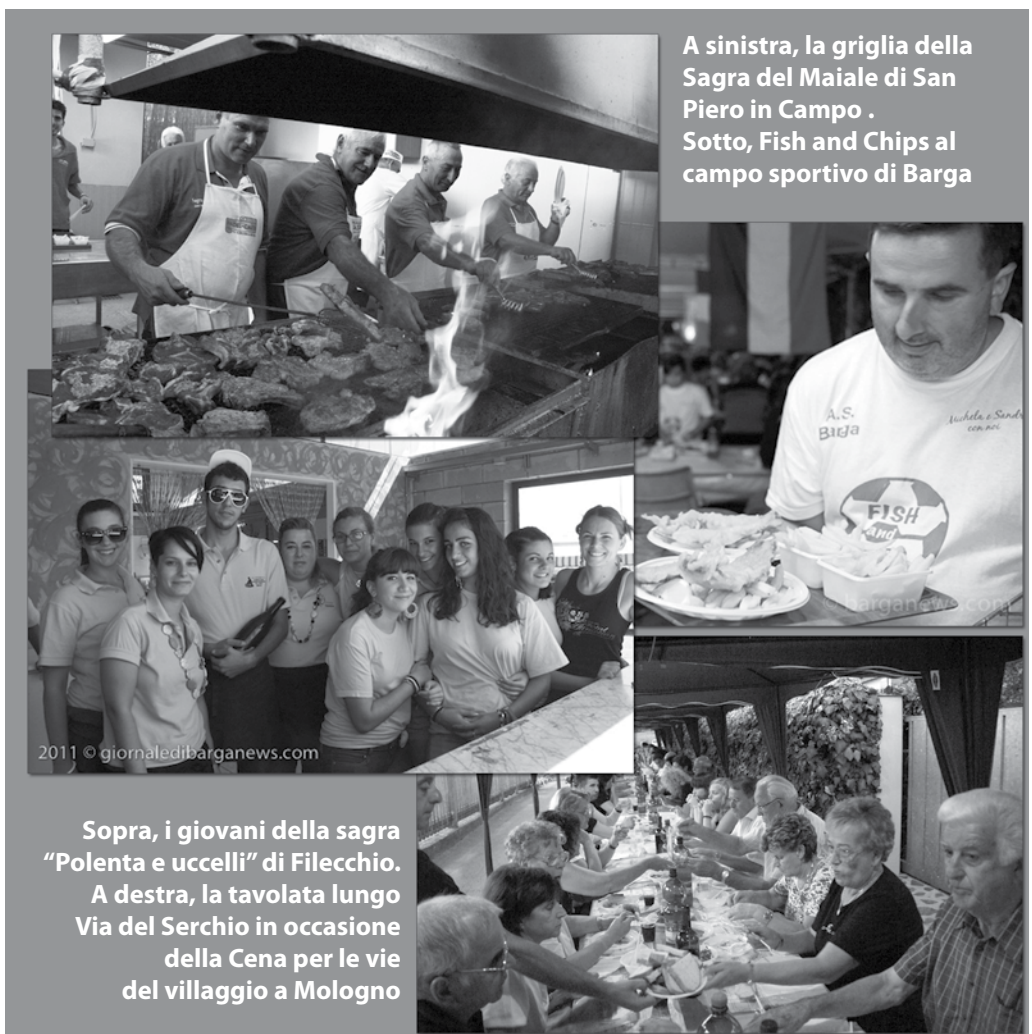
A sinistra, la griglia della Sagra del Maiale di San Pietro in Campo . Sotto, Fish and Chips al campo sportivo di Barga

L'appuntamento inizia il 27 luglio e si protrarrà fino al 17 agosto: tutte le sere oltre alla gastronomia che si arricchirà di tanti piatti della tradizione locale, non mancheranno anche musica e ballo liscio.