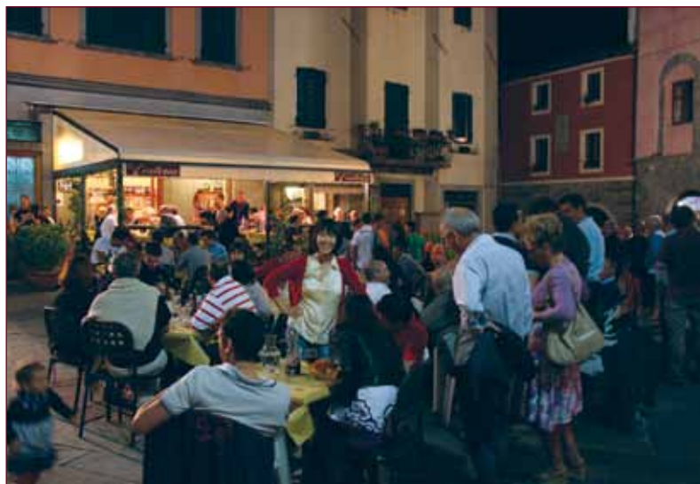
Gastronomia e musica nel centro storico di Barga

Infine il ritorno in piazza Salvo Salvi, del mercatino organizzato dai commercianti di Barga.