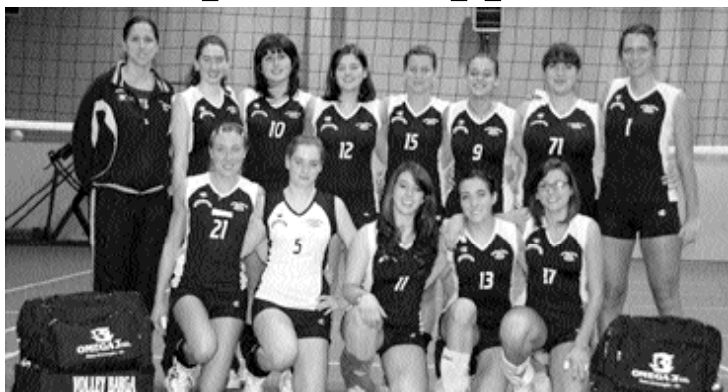
La formazione del Volley Barga

La partenza è a favore del Barga che riusciva ad aggiudicarsi il primo set, ma quando si andava al cambio subentrava un fenomeno non raro nello sport: la paura di vincere. Così il Garfagnana si portava in parità e poi sul 2 a 1.