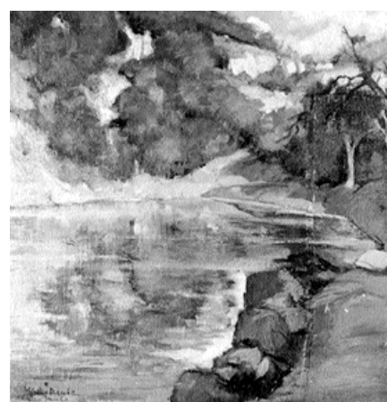
*** Alfredo Meschi: Lago Santo.

La mostra rimarrà aperta fino al 14 settembre 2008, accompagnata da un catalogo edito da Edizioni ETS (introduzione di Umberto Sereni, testo di Gioela Massagli, e nota biografica di Giovan Battista Meschi).