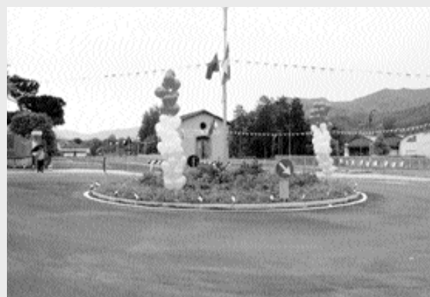
Un'immagine del nuovo parcheggio

La giornata è proseguita, disturbata dal maltempo, con i negozi aperti a Fornaci nel pomeriggio, la fiera regionale dei prodotti artigianali e la chiusura al traffico di via della Repubblica