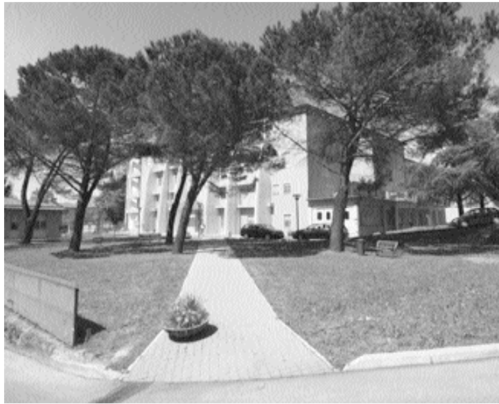
una veduta dell'Ospedale "San Francesco".