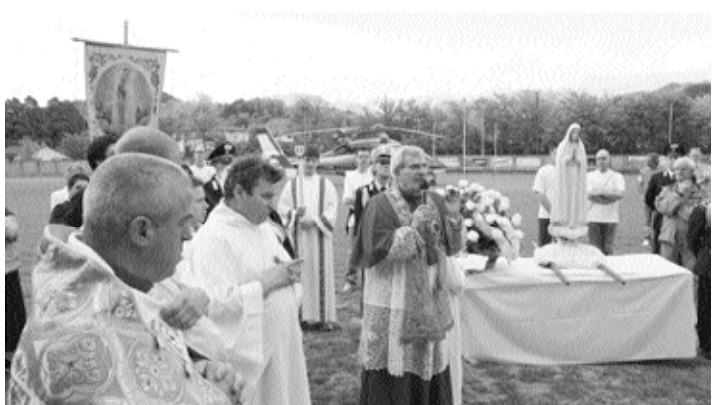
L'arrivo della Madonna di Fatima a Fornaci

La missione mariana si è chiusa domenica 18 maggio con una santa messa solenne celebrata dall'arcivescovo di Pisa, mons. Giovanni Paolo Benotto. Al termine della cerimonia il saluto alla sacra immagine nel piazzale don Minzoni.