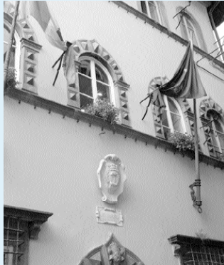
Un'immagine di Palazzo Pancrazi