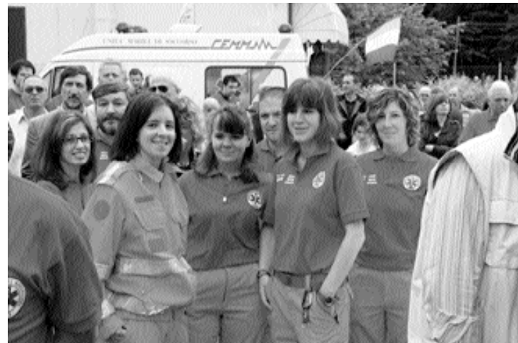
Nella foto alcuni volontari della Misericordia del Barghigiano