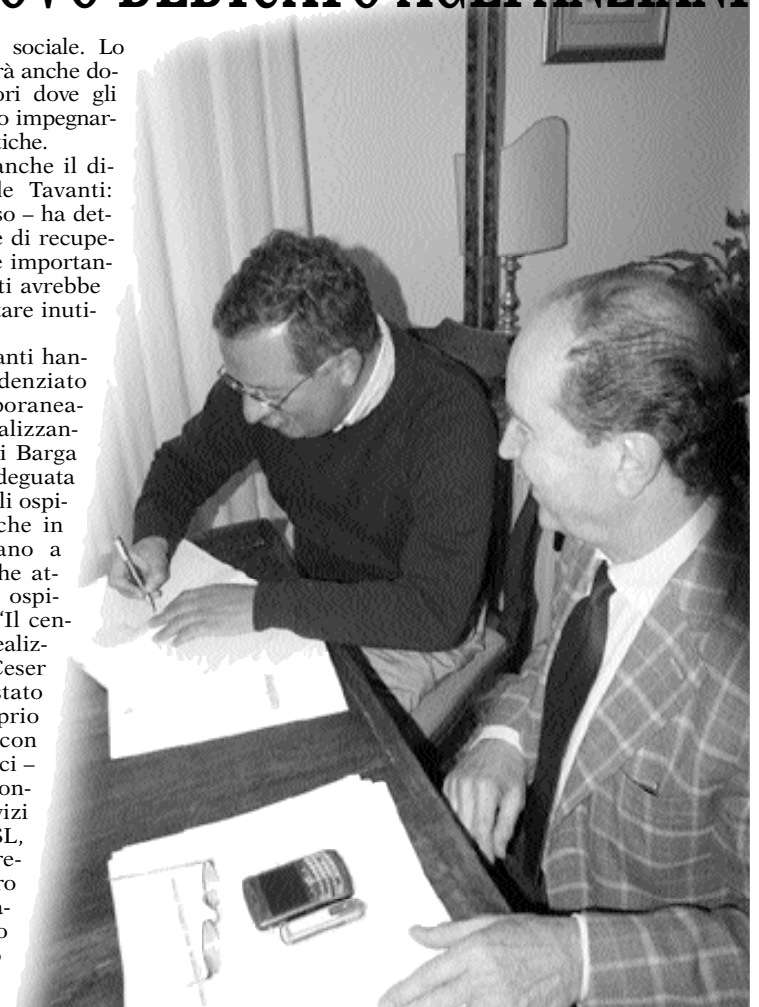
Il momento della firma dell'accordo