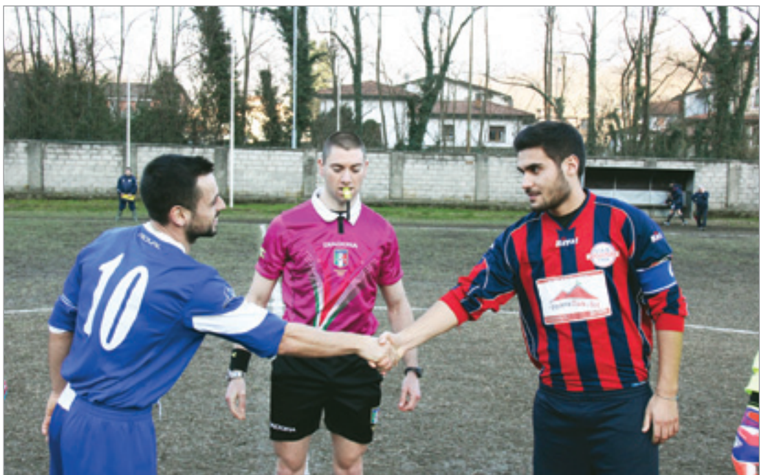
Tornerà anche quest'anno il derby Fornaci-Barga: nella foto, la gara della scorsa stagione