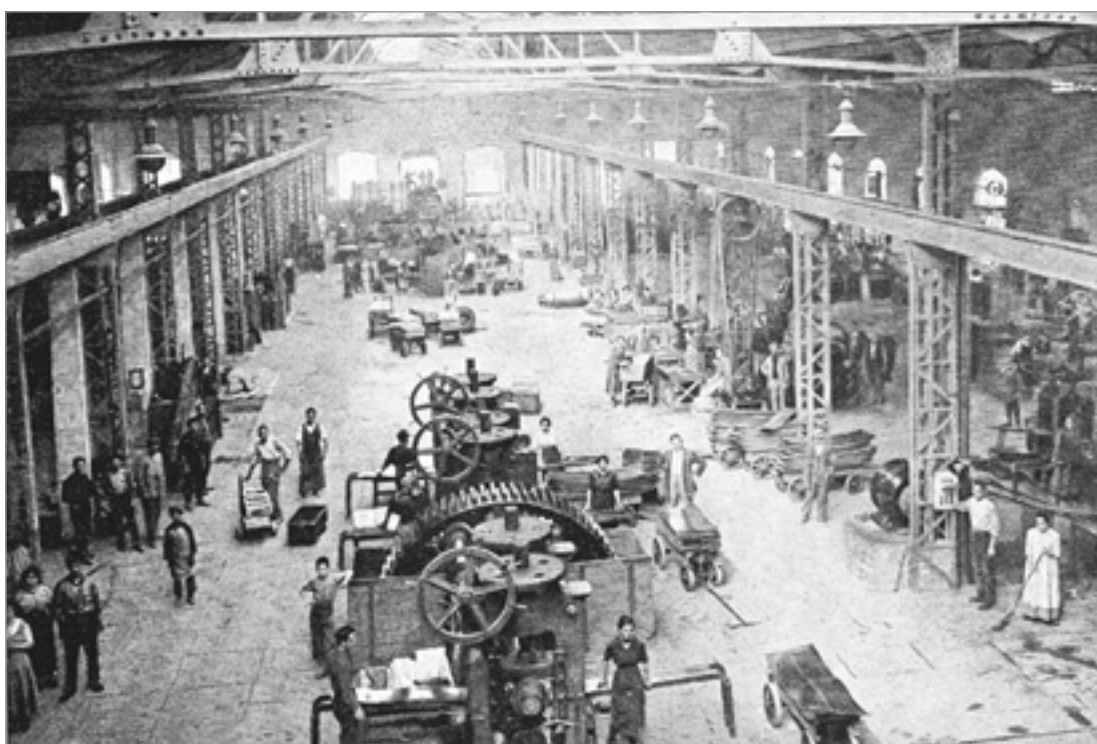
Alcune immagini dei primi anni di lavoro alla metallurgica