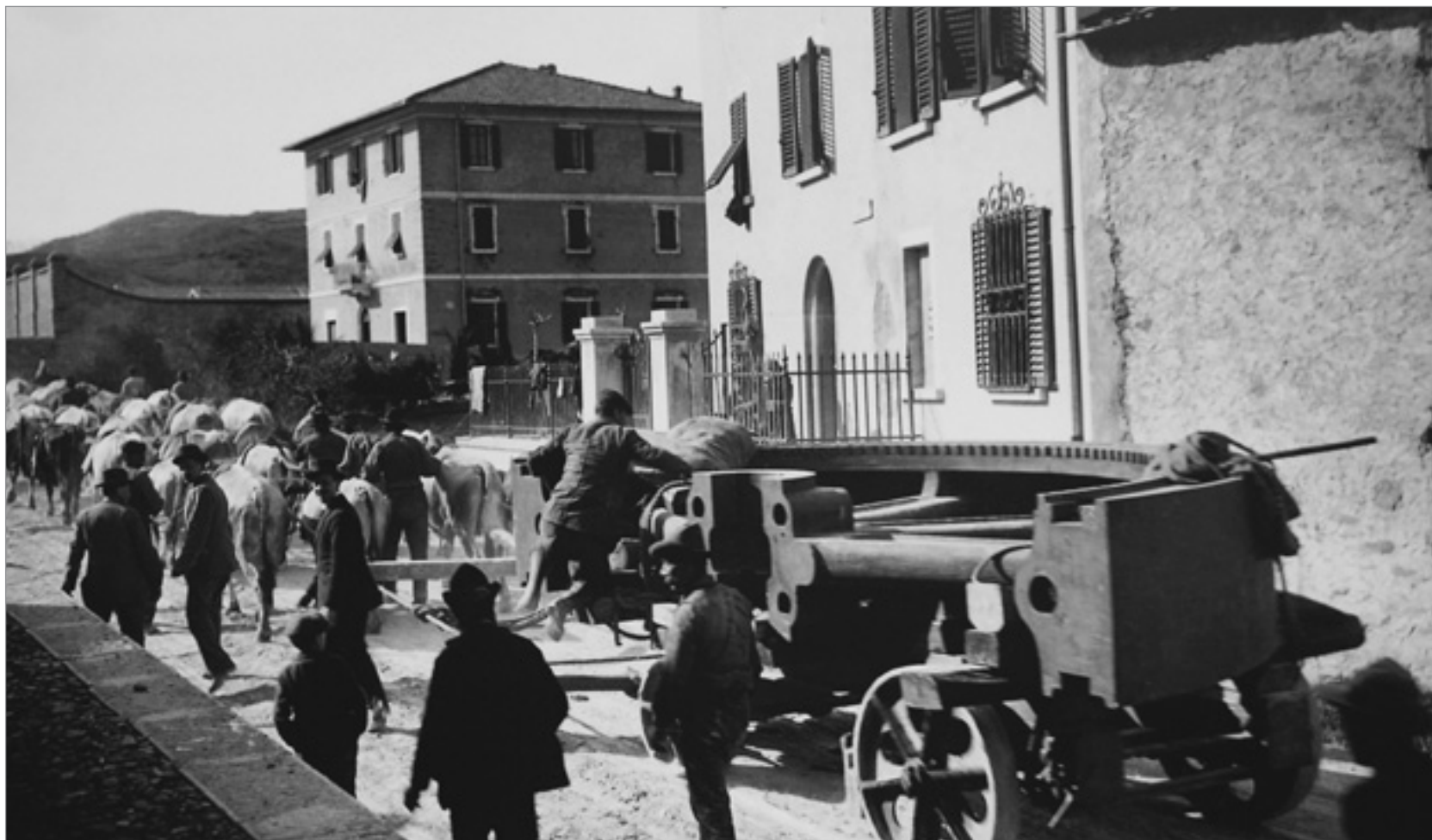
1915: iniziano i lavori per la costruzione del nuovo stabilimento a Fornaci di Barga

La guerra '15-'18 ha avuto notevoli ripercussioni sul nostro territorio dal punto di vista umano, sociale, materiale: in ricorrenza di un anniversario così importante, dedicheremo dunque una serie di articoli a come Barga e i suoi abitanti vissero il conflitto, e principalmente alla nascita e sviluppo della "Metallurgica", in vista del prossimo 2016, quando si celebrerà l'anniversario ufficiale, in occasione dell'entrata in attività della fabbrica un secolo prima.