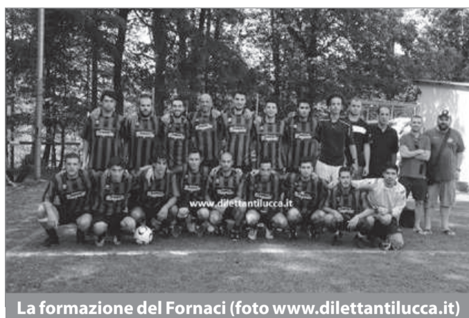
La formazione del Fornaci

L'esordio ufficiale domenica 9 settembre al "Moscardini" contro l'attrezzato