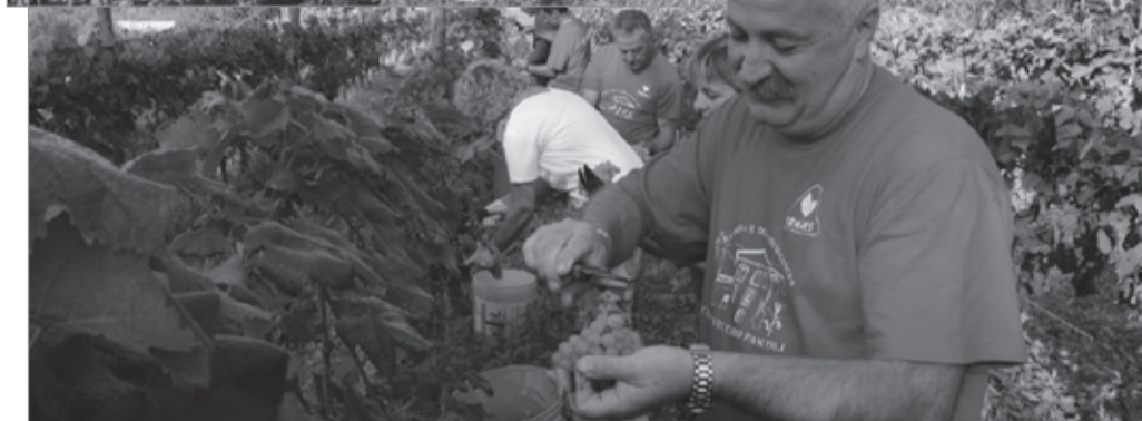
In basso, uno momento della giornata di lavoro

CHIUDE IN BELLEZZA LA SAGRA DELLA POLENTA E UCCELLI