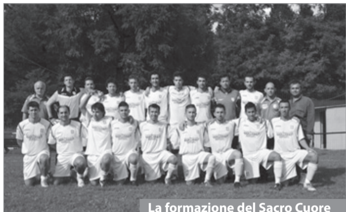
La formazione del Sacro Cuore

In Promozione va un po' meno bene il cammino del Barga che in quattro partite ha ottenuto solo quattro punti. Nell'ultimo turno la squadra ha perso in casa contro la Vaianese, avversario ostico da sempre per gli azzurri, in una rocambolesca partita dove forse il pari sarebbe stato cosa più giusta. Nonostante la giovanissima età di questo organico, comunque le potenzialità non mancano e neppure l'impegno. C'è tempo insomma per rifarsi.