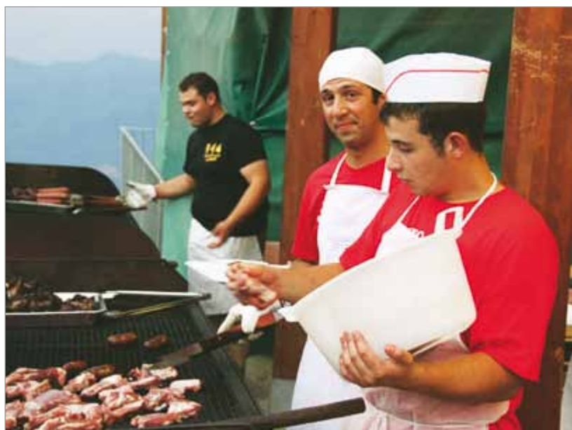
Sagra di Pagnana