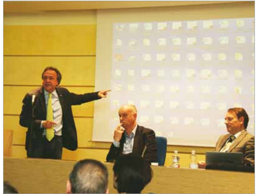
Il sindaco di Castelnuovo Tagliasacchi, quello di Barga Bonini e l'ex direttore generale Polimeni alla conferenza dei sindaci per la sanità

Tra le altre cose i sindaci precisano che per quanto riguarda le nuove sale operatorie presso il Presidio di Castelnuovo Garfagnana, ad oggi si parla di un investimento di circa 4 milioni di euro, senza però che ci sia un progetto esecutivo approvato e quindi una certezza dei finanziamenti per poterle realizzare; rispetto alla nuova sala chirurgica blocco parto presso il Presidio di Barga, poiché siamo in presenza di un progetto esecutivo, di un finanziamento esistente e di una gara già da tempo effettuata con l'aggiudicazione alla ditta vincitrice, i sindaci