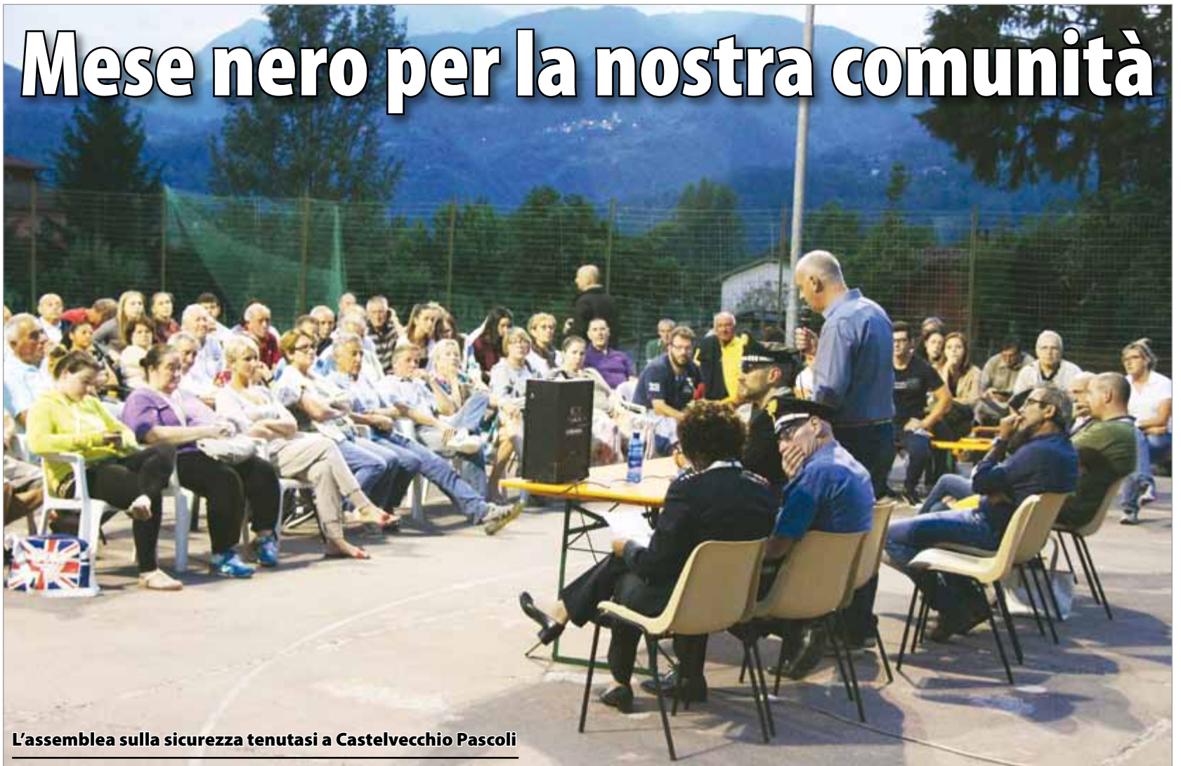
L'assemblea sulla sicurezza tenutasi a Castelvecchio Pascoli