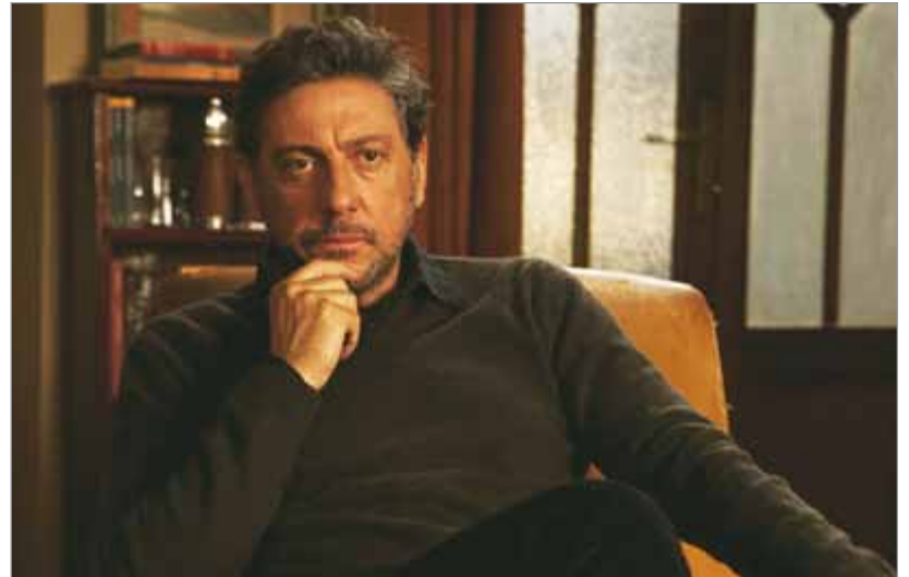
L'attore Sergio Castellitto