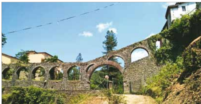
Sopra, il taglio degli alberi presso il parco Kennedy e la porzione di vecchie mura ed acquedotto liberate alla vista. Nella colonna a fianco, il cantiere di Barga Giardino