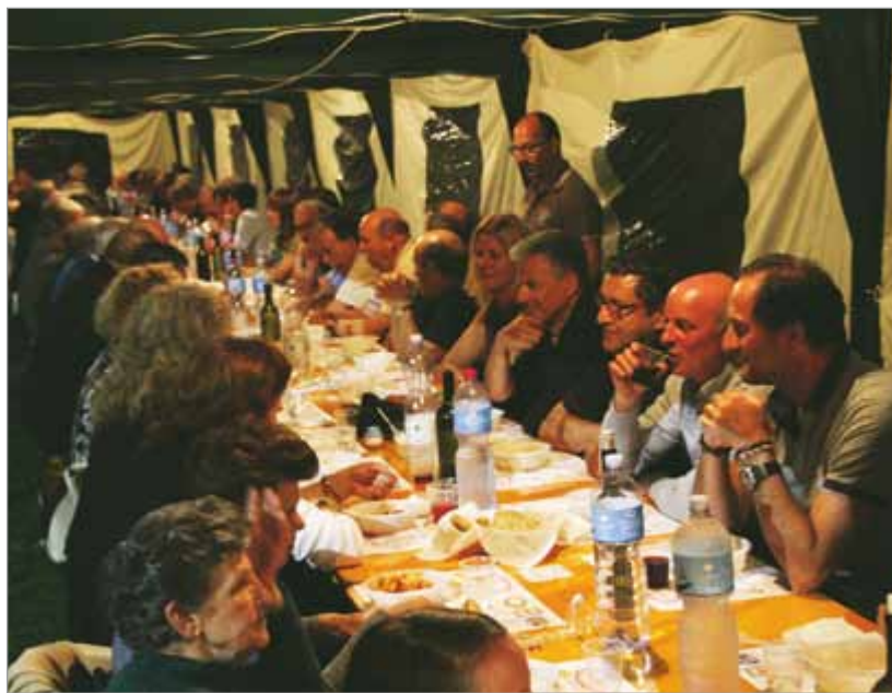
Cena per le vie di Mologno