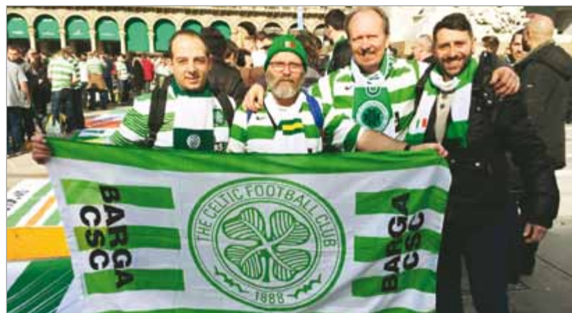
Barga Celtic Supporters Club in trasferta a Milano

BARGA – Anche quest'anno a Barga si terrà, giunto alla sesta edizione, il Meeting Nazionale dei Celtic Supporters Club italiani nei giorni 8 e 9 agosto.