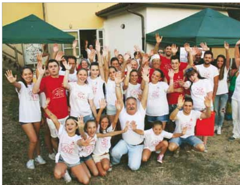
Festa a Castelvecchio