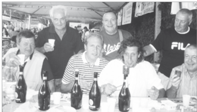
Gli operai del Comune ti vogliono ricordare così