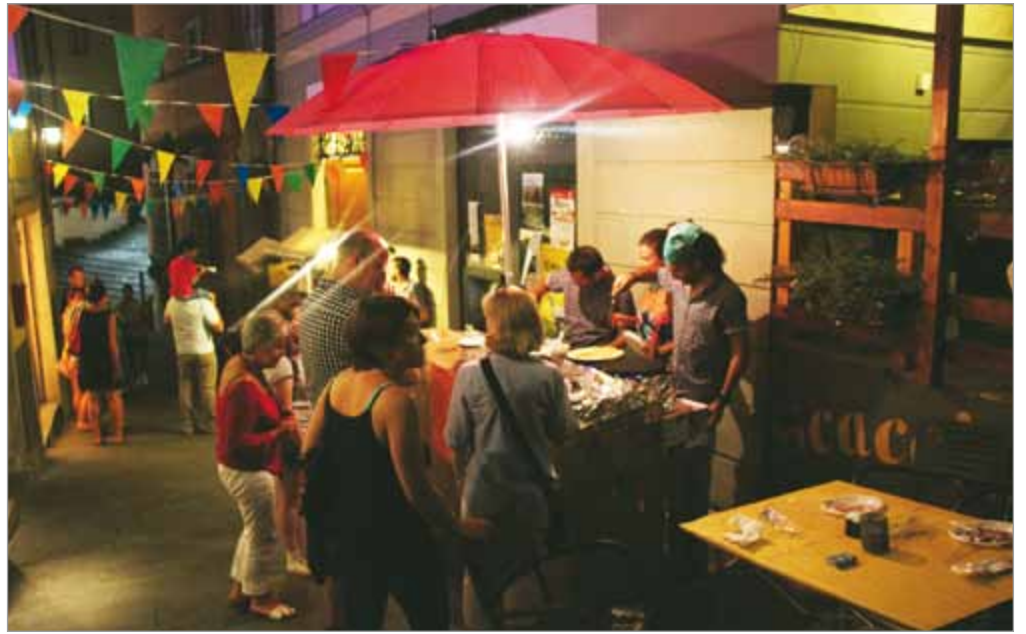
La prima serata di Live in Barga 2015

Da ricordare, anche di questo ripareremo, la decima edizione della rievocazione della trebbiatura del grano, andata in scena a San Pietro in Campo il 19 luglio scorso.