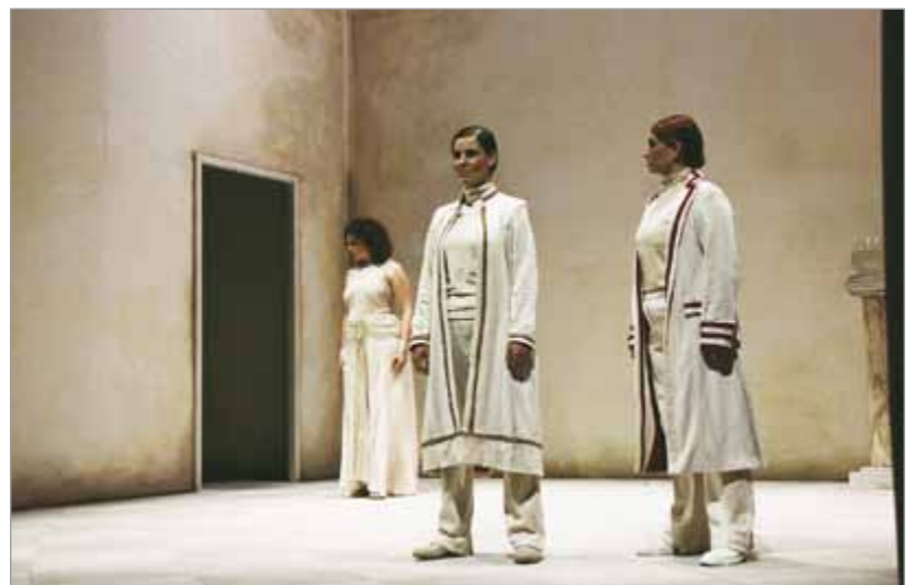
Il "Catone" di Händel messo in scena per Opera Barga 2015

Tra le novità di quest'anno una serie di concerti con l'Ensemble contemporaneo parigino Multilaterale. Il gruppo ha presentato 10