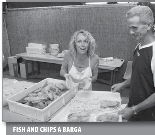
FISH AND CHIPS A BARGA