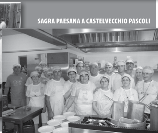
SAGRA PAESANA A CASTELVECCHIO PASCOLI