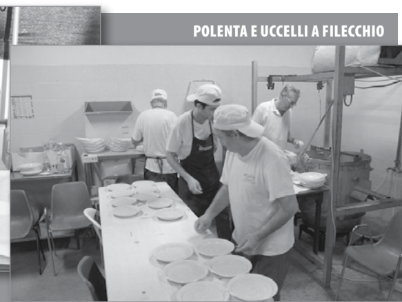
POLENTA E UCCELLI A FILECCHIO