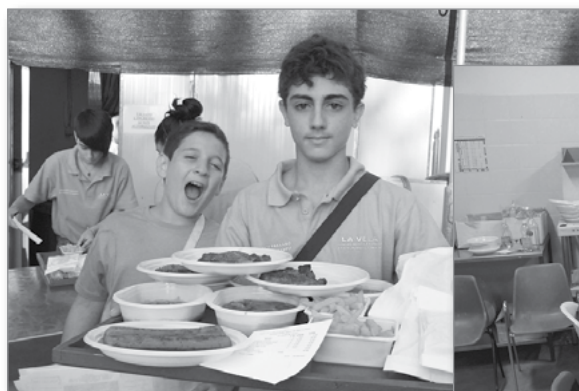
SAGRA DEL MAIALE A SAN PIETRO IN CAMPO

La sagra nasce nell'estate del 1977 quando alcuni amici dell'allora circolo M.C.L. decidono di organizzare una "mangiata" che oggi è divenuta uno degli avvenimenti