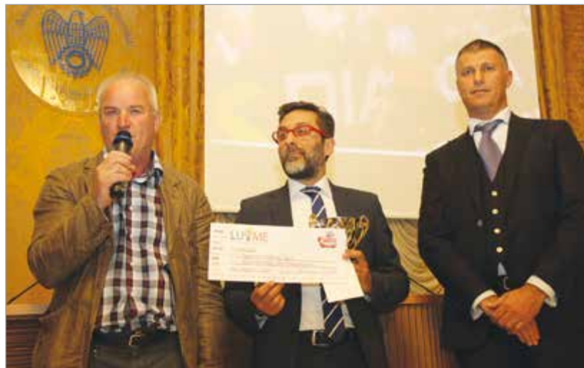
Le premiazioni in favore di Piaggiagrande, GVS e Misericordia