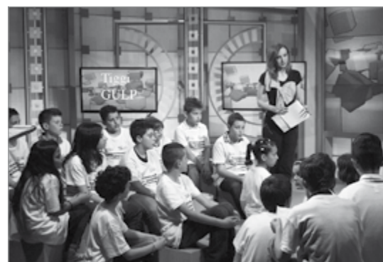
Nella foto, la partecipazione al Tiggi Gulp

in un'aula a Roma, negli studi di Saxa Rubra in diretta al "Tiggi Gulp", il nostro progetto "La Bacola e il Lupo": leggende, attività e sapori delle montagne barghigiane.