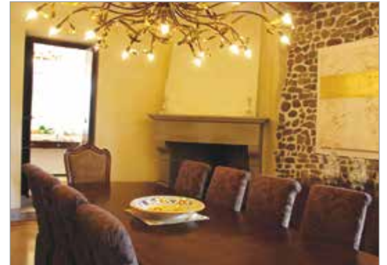
Nelle immagini, villa Via Sacra. Molte le opere d'arte qui esposte

BARGA – C'è una novità importante che riguarda la Community of Jesus (comunità di Gesù), una comunità monastica ecumenica fondata negli anni '70 negli Stati Uniti e che vive seguendo i principi della tradizione benedettina. E che dopo l'America ha trovato una seconda dimora proprio nella nostra cittadina in quella che era villa Gramigna e che oggi si chiama villa Via Sacra.