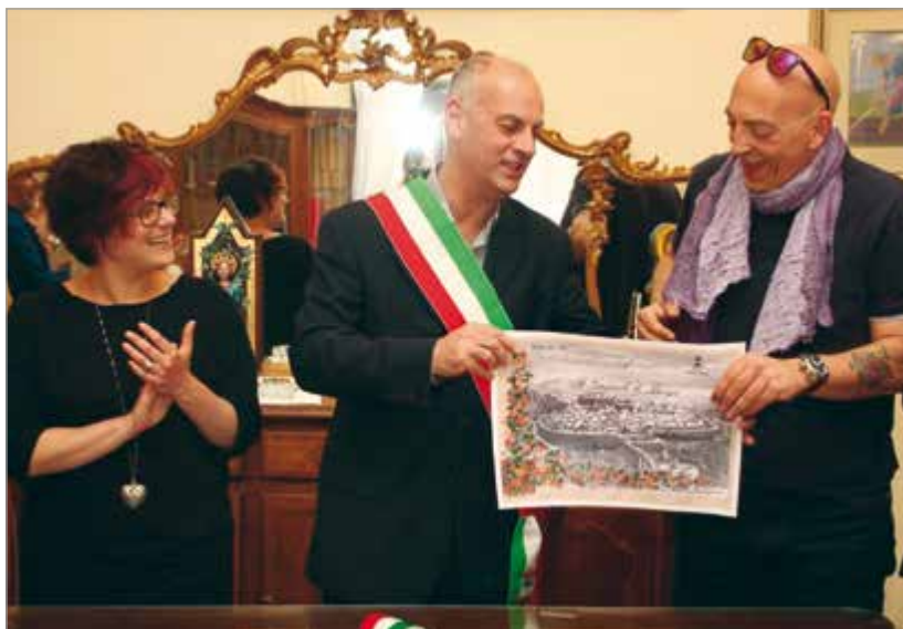
La consegna della pergamena da parte del sindaco

Ma una cosa la vogliamo sottolineare: un giornale, piccolo, che compie oggi 65 anni, in questi tempi di difficile crisi dell’editoria; che riesce ancora oggi, pur avendo scelto di sviluppare il proprio lavoro anche sul web, a stampare una edizione cartacea, rappresentano un fatto davvero importante. In netta controtendenza con la progressiva scomparsa di tanti piccoli e grandi giornali nella loro versione cartacea. Noi ci proviamo a tirare avanti. Ci proviamo a continuare