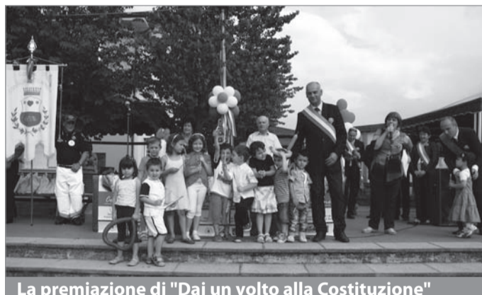
La premiazione di "Dai un volto alla Costituzione"

"CIPAF per il sociale", organizzata dai commercianti per promuovere le realtà associative della zona e per raccogliere fondi a favore dell'AMREF. Presso il Campo Polivalente sono state cucinate focacce leve e crêpes per cenare in compagnia degli stand di Amatafrica, Amoa, Arca della Valle, Filo d'Arianna, Gruppo Giovani del Vicariato, Misericordia del Barghigiano, Misericordia di Galliciano, Olos che hanno partecipato all'evento. In serata, poi si è tenuto il triangolare di calcetto tra i commercianti del CIPAF, l'Amministrazione Comunale ed i Carabinieri vinto proprio dall'Arma. Insomma, un bel finale per una giornata davvero ricca che ha celebrato al meglio non solo la ricorrenza della Repubblica, ma anche la vitalità, non solo commerciale, di Fornaci.