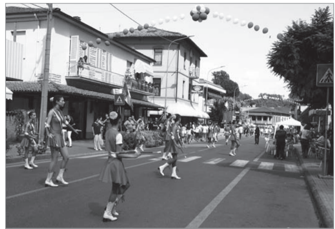
Le majorettes sfilano per via della Repubblica