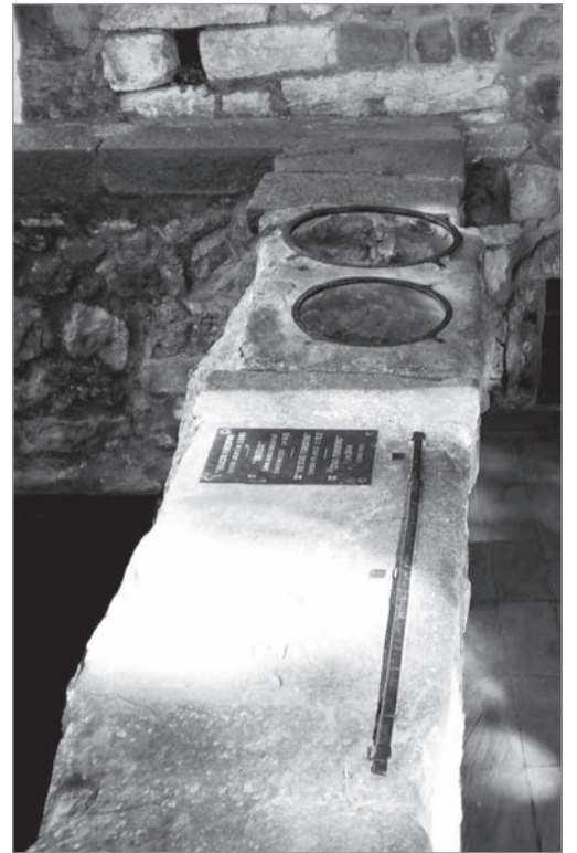
Le antiche misure di Barga esposte sotto la loggia di Palazzo Pretorio

I due contenitori di capacità ricavati in un unico masso di pietra arenaria è vero che sono lo Staio e il mezzo Staio, quest'ultimo detto in Toscana anche “Mina”, però al suo esecutore fu raccomandato dal governo locale di “giustarli” alla misura di Barga, che non sapendo quale sia nella sua capacità rapportata agli odierni litri, sarebbe utile misurarla. Comunque da una prima e molto empirica misurazione abbiamo riscontrato non sia quella fiorentina così come recita l'odierna legenda.