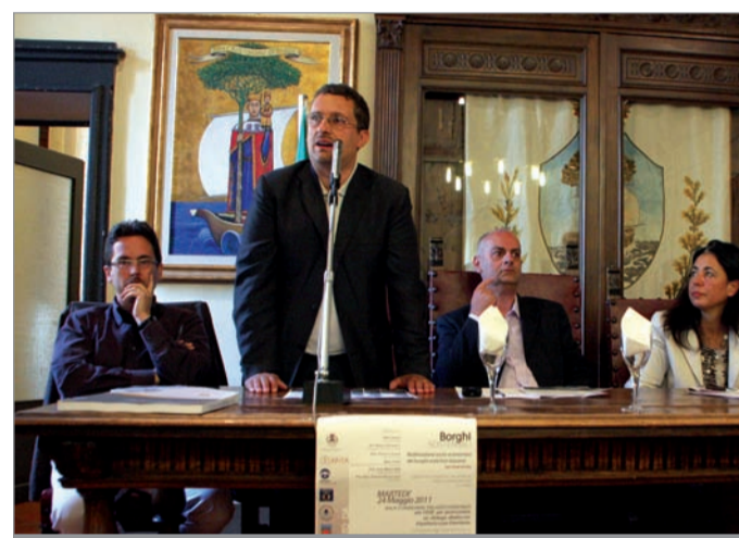
Un momento della conferenza stampa di presentazione

Questa non è che una fase preliminare del progetto, che dovrà poi essere analizzato e valutato secondo la fattibilità e gli importi economici, ma comunque è un ottimo "continuum" ai diversi interventi di recupero e valorizzazione avviati in tempi recenti sul territorio, come il Progetto Rocche e Fortificazioni o il museo della Pace a Sommocolonia.