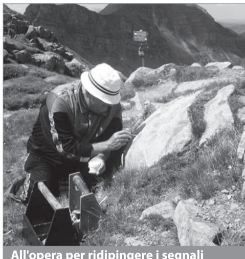
All'opera per ridipingere i segnali

Sedici soci del CAI hanno raccolto l'invito ed armati del necessario hanno percorso il n° 18 per tagliare alberi caduti o cresciuti fuori sede, risistemare tratti di sentiero, ritracciare i caratteristici segni bianchi e rossi. Per segnalare il sentiero che si snoda per la prima parte nei boschi e poi sul fianco nudo del Rondinaio sono stati sistemati 12 segnavia in castagno e costruite 4 "madonne" o "omini", mucchi di pietre che poi, contrassegnati con i colori e il numero del sentiero indicano il percorso senza essere