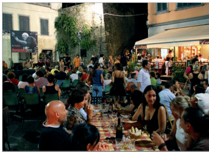
La scorsa edizione della festa del centro storico

A livello di territorio gli arrivi in Media Valle sono stati 42.984 con un + 5,4% e le presenze 162.361 con un +5,3%. In Garfagnana gli arrivi sono stati 35.973 con un - 6,2% e le presenze 39.350 con un - 2,6%.