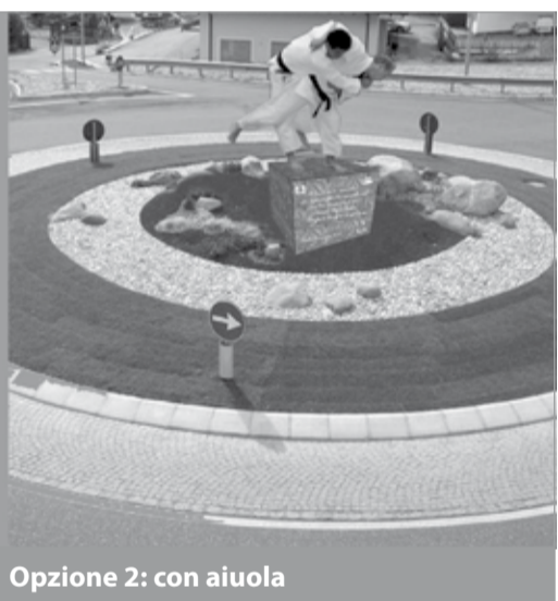
Opzione 2: con aiuola