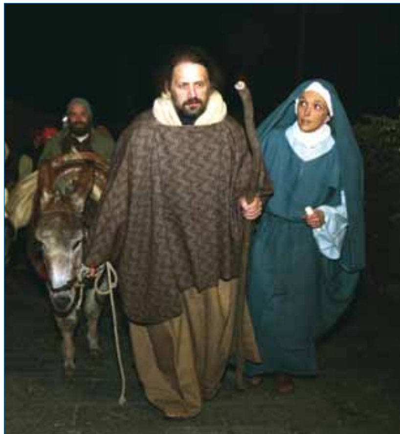
Un Presepe Vivente di qualche anno fa

Altro, dunque, che tenerezze, commozioni anch'esse di circostanza, anch'esse formali, fors'anche superficiali: il Natale è senz'altro un grande inno all'umiltà; e