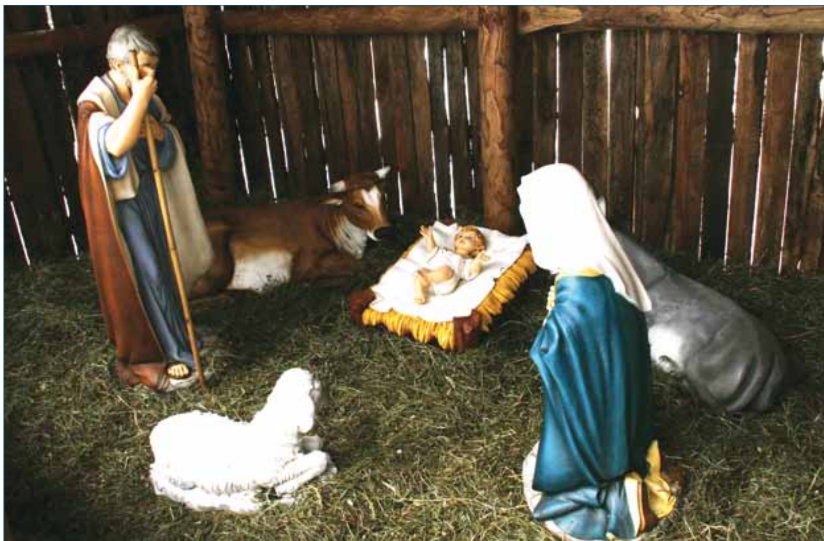
Il presepe realizzato presso la stazione dal Comitato Paesano di Mologno