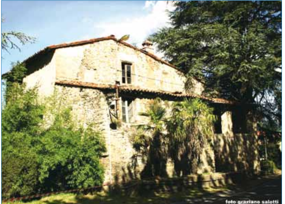
La casa dei Buglia a Fornaci

Prima, nel 1509, c'è il pronunciamento in materia dell'imperatore Massimiliano I d'Asburgo, poi, nel 1513, il Lodo di papa Leone X sancì per cinquanta anni il Gragno lucchese con affitto da pagarsi a Barga e infine, nel 1563, che ognuno tornasse nelle sue possessioni. Venne quel tempo e apriti cielo! Lucca non volle sentire ragioni e le beghe divennero incandescenti come già lo furono in precedenza, dal 1551 al 54, quando dalla Vicaria di Galliciano partirono ambasce a Lucca per il pericolo che Barga stesse per muovergli guerra per il possesso del Gragno. In regime di scaduto Lodo di Leone X e in attesa del successivo, era il 1567, la milizia di Barga prende possesso del Monte di Gragno, che tenne per un mese, poi lasciando le guardie a Bolognana e S. Lu-