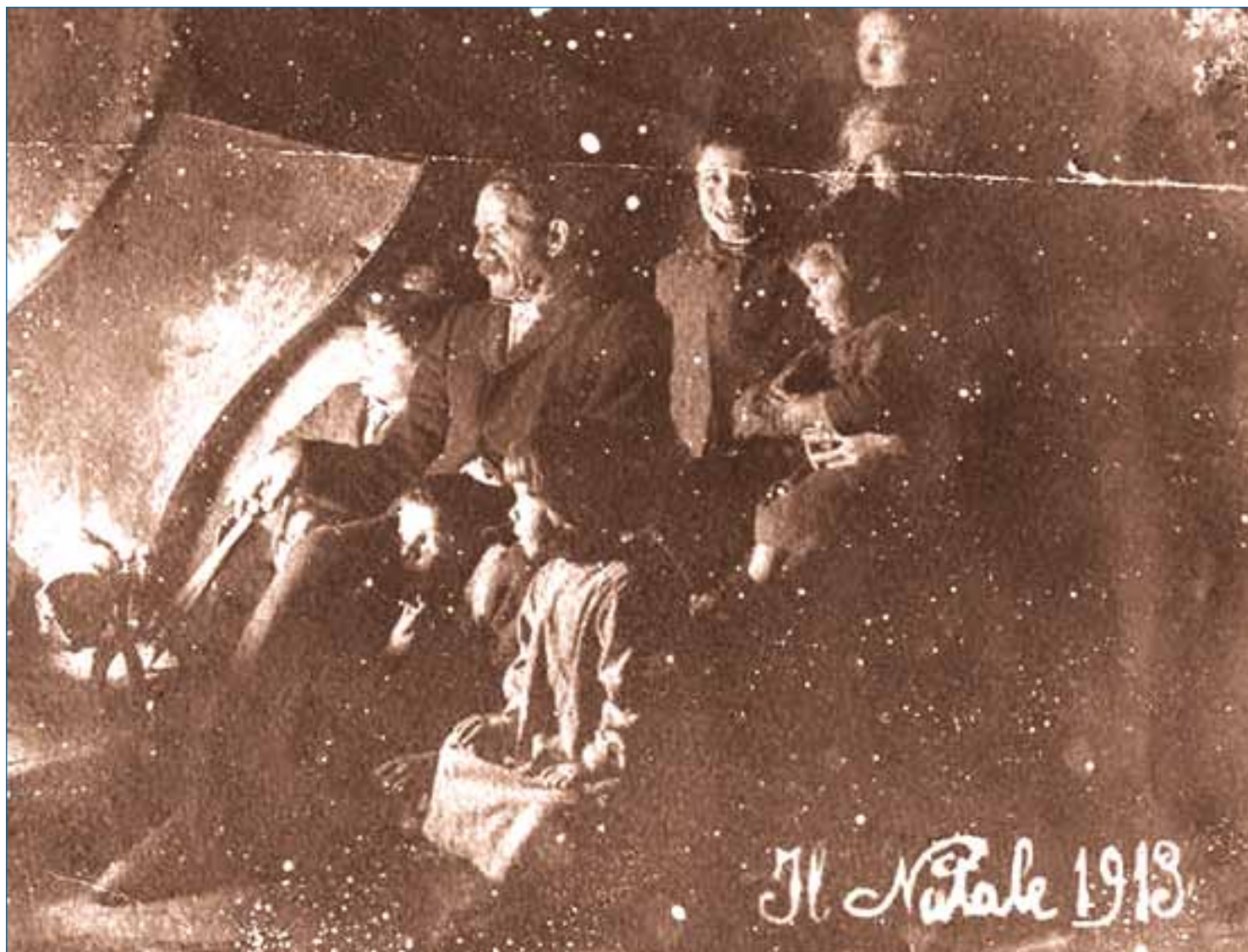
Natale 1919: una famiglia della Garfagnana seduta davanti al ceppo natalizio in una foto dell'epoca

stranamente macabro e patetico nonostante l'aria festosa del Natale. Trattasi del "Ceppo".