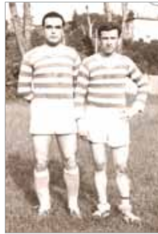
"Il Fone" e "il Patata"

Il doppio dell'Immacolata lo aveva portato con sé in valigia inciso su un nastro, una voce amica da ascoltare nei momenti di nostalgia. In Germania dove aveva scelto di vivere per necessità, aveva costruito una bella famiglia allietata da pochi anni dalla nascita di una nipotina. Non dimenticando mai le sue radici e da mesi provato nel fisico, ha deciso di intraprendere un ultimo