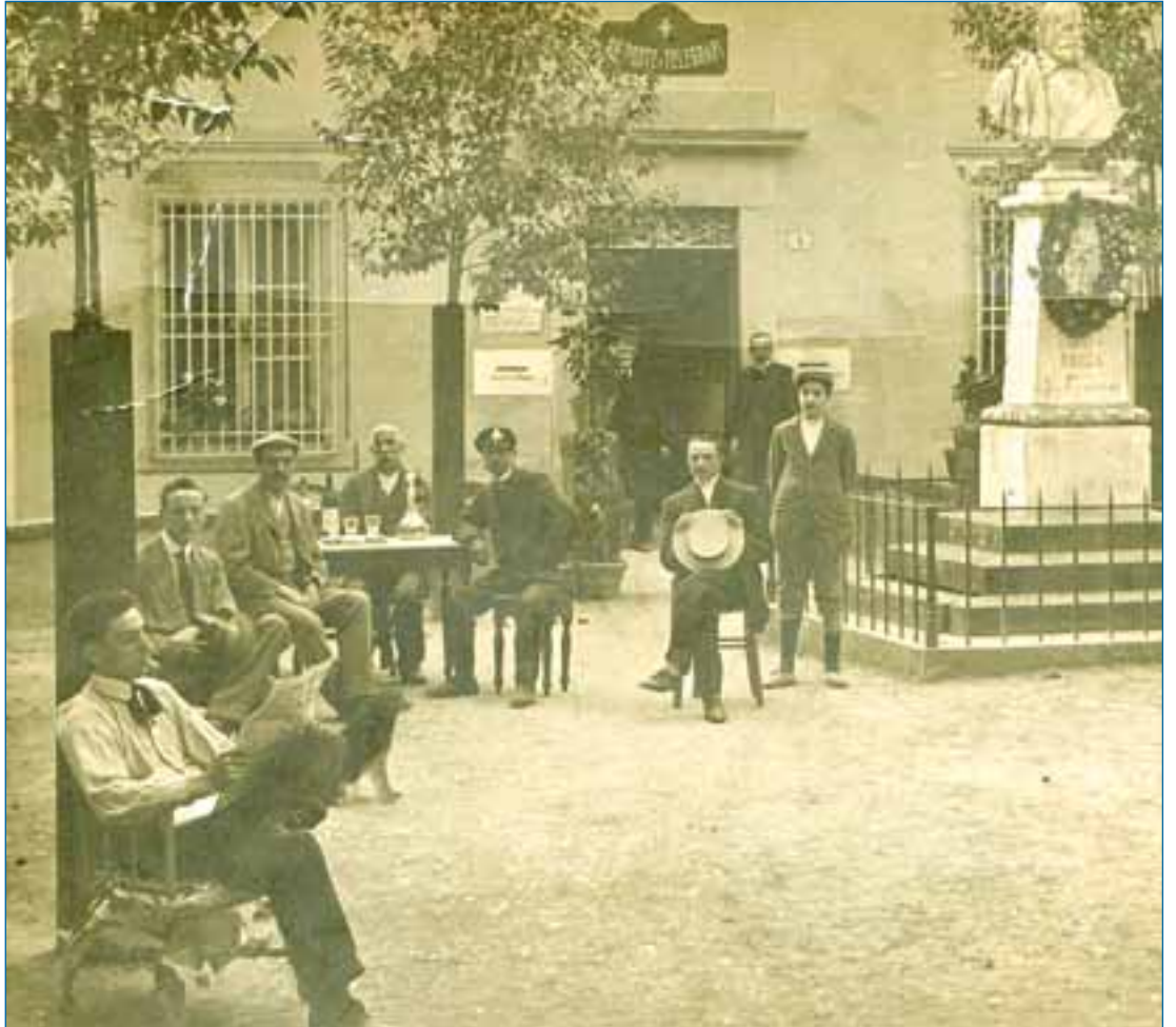
Piazza Garibaldi agli inizi del secolo scorso

Nonostante le continue sollecitazioni la raccolta natalizia non fruttò granché, ad eccezione di alcune cospicue offerte, in particolare da parte degli emigrati di