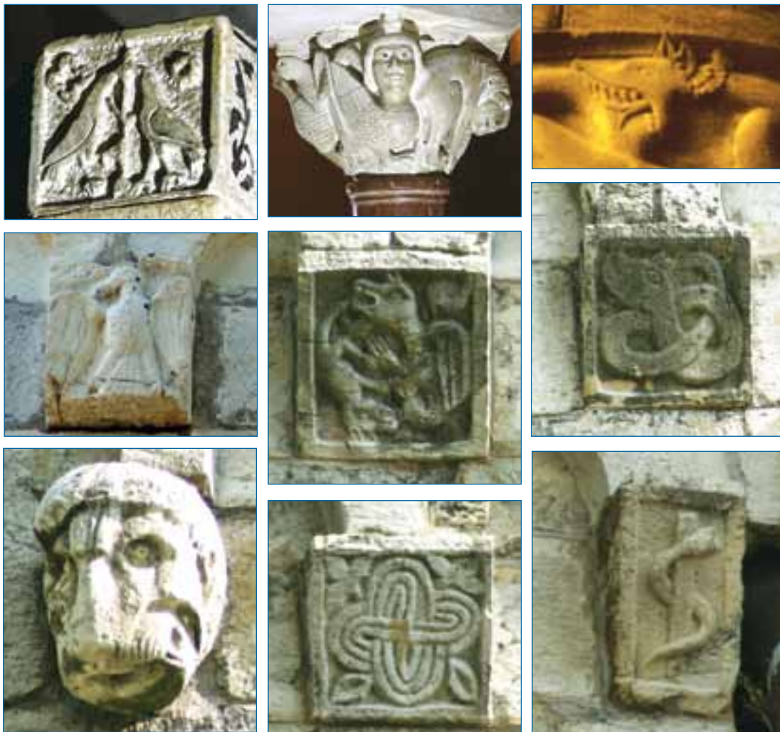
Alcuni delle immagini simboliche contenute all'interno e all'esterno del Duomo di Barga. Nella terza immagine da destra della prima fila, il serpente di Aleppo (Siria)

Inoltre, alla simbologia templare sono riconducibili numerose rappresentazioni della "croix pattée", la croce patente, scolpita in molti esemplari: una in particolare, di grandi dimensioni, è presente, sul lato destro in alto, nella zona prebiteriale della chiesa.