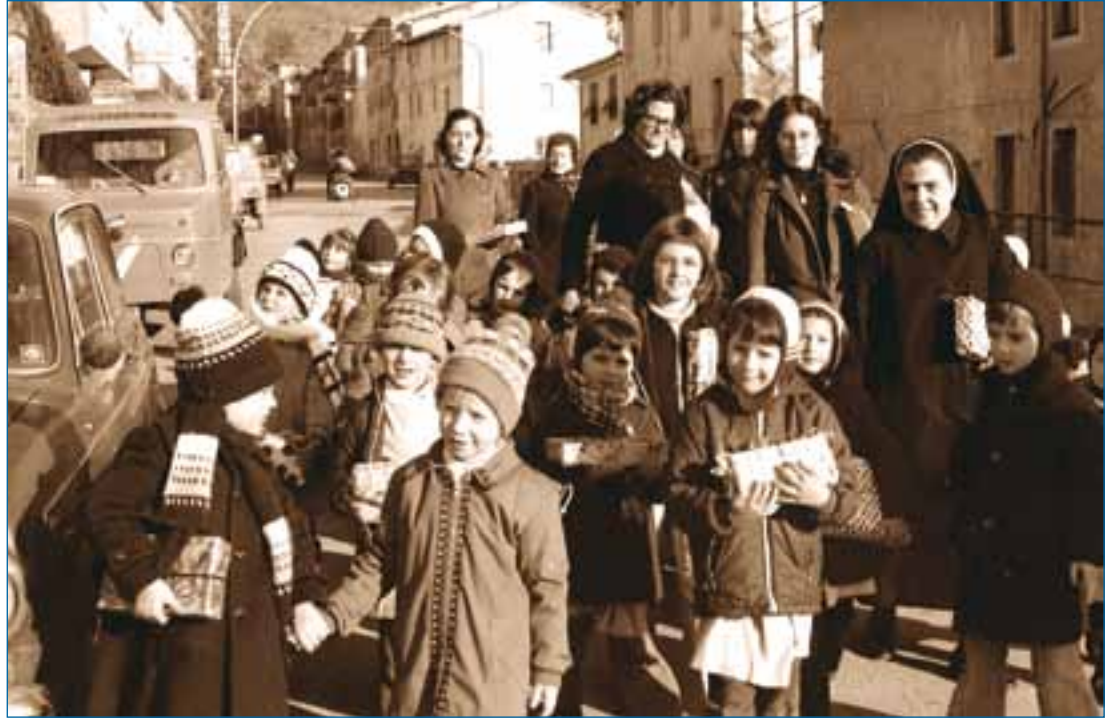
I regalini di Natale dei bambini dell'asilo Donnini per gli anziani della casa di riposo (anni '80).

Quest'anno nelle nostre case costruiamo un bel presepio con al centro Gesù bambino, le tradizionali pecorelle, i pastori, i re Magi. E con la nostra fantasia mettiamoci dentro tanti nostri bei ricordi, tante stelle nel cielo illuminate dalla cometa. E sopra ogni cosa non facciamo mancare la nostra preghiera.