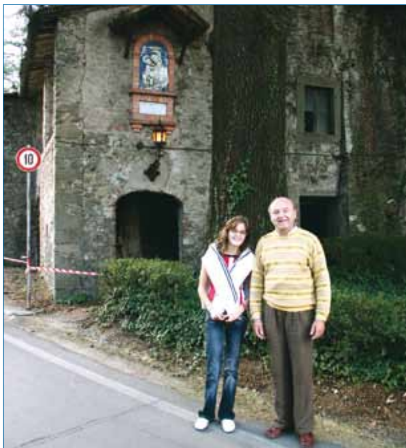
I discendenti della famiglia Buglia

Se queste cose narrate ebbero una conclusione felice, non altrettanto possiamo dire dei fatti di un anno dopo. Questa ce la racconta Pietro Magri nel suo "Il Territorio di Barga" del 1881, pag. 41: "Alcuni