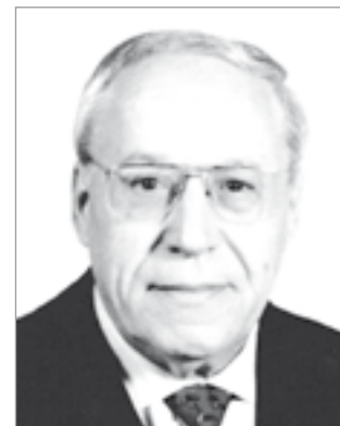
19 marzo 2016

Il tempo non conta per il cuore. Si può amare anche stando lontani e quell'amore se è vero e puro non morirà mai neanche fra mille anni.