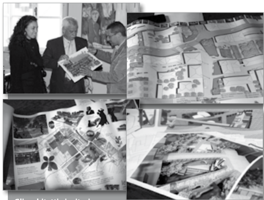
Gli architetti vincitori del concorso e le immagini dei progetti primi classificati. A breve saranno esposti per essere visionati dalla cittadinanza.

È stato il sindaco Bonini a chiudere la riunione, annunciando che i progetti del concorso saranno adesso esposti in una mostra pubblica dove i cittadini potranno confrontarsi e conoscere le varie idee. Ha anche aggiunto che le soluzioni che l'Amministrazione riterrà più interessanti saranno recepite nel nuovo Regolamento Urbanistico che sarà in adozione nel corso delle prossime settimane. Dopo partirà la corsa alla ricerca di finanziamenti per la realizzazione dei progetti.