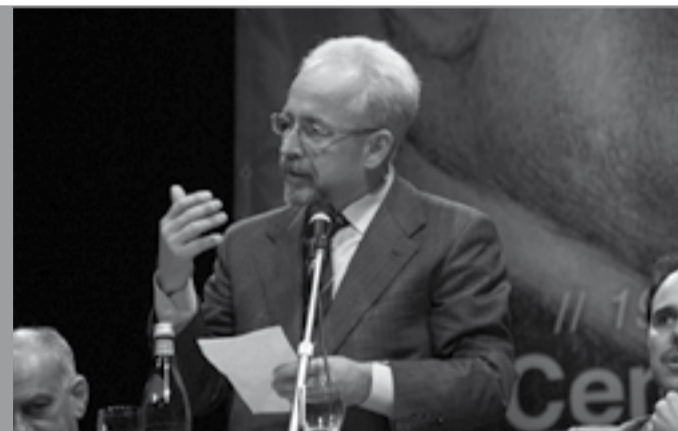
Alcuni momenti delle celebrazioni: a sinistra l'arrivo delle autorità al "Differenti", al centro i relatori durante la commemorazione, a destra il sottosegretario Roberto Cecchi