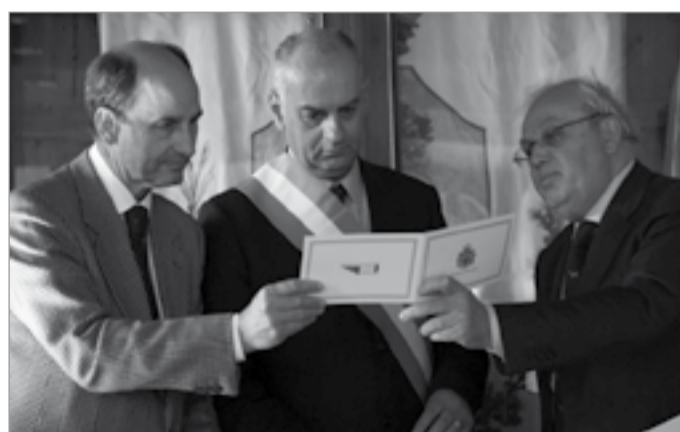
Adami e Bonini ricevono l'omaggio di San Marino

BARGA – Anche la repubblica di San Marino celebra il centenario della morte di Giovanni Pascoli, in questo caso con l'emissione di una moneta da 5 euro in argento realizzata dall'Azienda autonoma di stato filatelica e numismatica. Un omaggio che va ad aggiungersi al francobollo emesso da Poste Italiane e alla moneta da due euro coniata dalla Zecca di stato, entrambi recanti l'effigie del Pascoli.