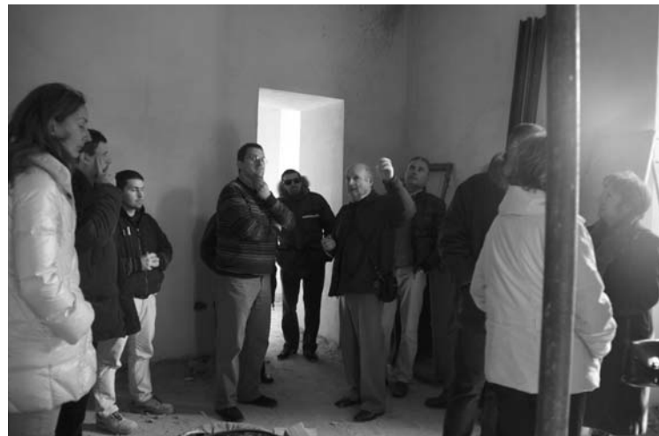
Un momento del sopralluogo

BARGA - Villa Gherardi sarà restituita alla scuola e alla comunità il prossimo mese di settembre. Questo quanto annunciato nel corso di un sopralluogo al cantiere da parte dell'Amministrazione Comunale e dei tecnici. Nella storica dimora (che si sviluppa su tre piani più la mansarda e inserita in un parco di 30mila metri quadrati dove si trovano le scuole superiori), chiusa perché interessata da lavori per la messa in sicurezza antisismica, l'Alberghiero con il prossimo anno scolastico potrà tornare a svolgere l'attività didattica. Il primo lotto dei lavori, per una cifra di 650mila euro, sarà ultimato nei prossimi mesi in tempo per il nuovo anno scolastico. Altri 600mila euro sono già preventivati per intervenire anche sulla ex filanda adiacente la Villa che sarà destinata alla funzione di rappresentanza e ricevimento. Previsto anche il totale recupero dell'area esterna, un ampio giardino verde. I lavori del secondo e terzo lotto partiranno non appena concluso l'intervento sulla Villa. In tutto l'importo che sarà speso su Villa Gherardi è 1 milione e 250mila euro finanziati da CIPE, Regione, Comune, in collaborazione con la Provincia.