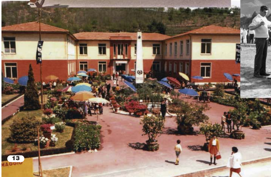
Nelle foto: 4/6/8/10 - Gli albori della manifestazione durante gli anni '60 2/3/14/15 - L'edizione del 1969, l'unica ad essere stata organizzata presso il "Campone" 11 - Un raduno motociclistico degli anni '70 1/5/7/12/13 - Alcune immagini della festa negli anni '80