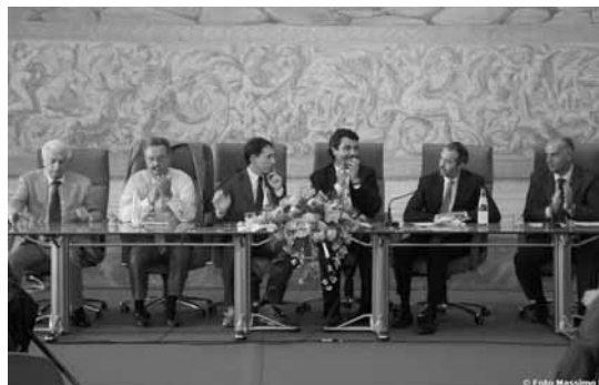
Un momento del Convegno di Lucca

Ma il centenario della nascita di Arrigo Benedetti è stato anche l'occasione per presentare un'importante iniziativa che si terrà ogni anno nella nostra cittadina, il premio giornalistico Arrigo Benedetti - Città di Barga, che premierà giornalisti professionisti e alunni all'ultimo anno delle scuole superiori per gli articoli che meglio sapranno interpretare la realtà dell'Italia contemporanea.