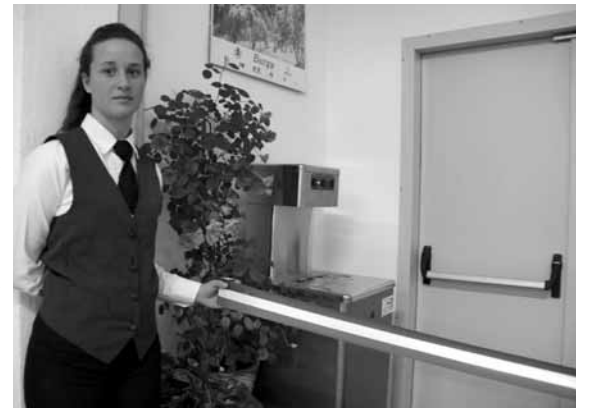
L'inaugurazione della fontanella installata presso l'ISI di Barga