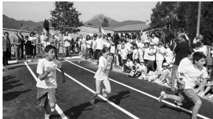
Un momento dell'inaugurazione

BARGA - Una vera e propria festa della scuola lunedì 7 giugno a Barga per l'inaugurazione dei nuovi impianti sportivi a servizio delle scuole superiori e della scuola media di Barga.