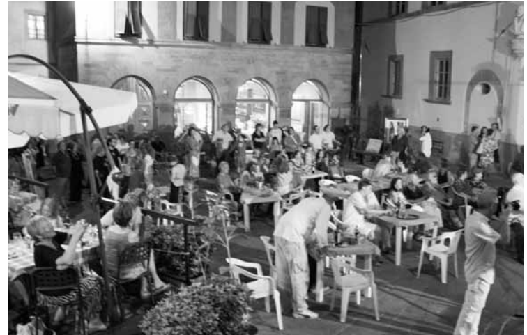
Un'immagine di Piazza Angelio durante la scorsa edizione della festa

L'organizzazione della Festa del Centro Storico 2010 vede anche il patrocini-