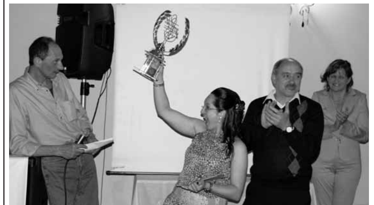
La vincitrice della competizione