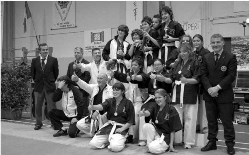
Un momento della premiazione del trofeo di Sound Karate svoltosi a Barga.