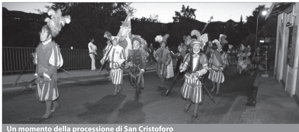
Un momento della processione di San Cristoforo

Assieme al premio a Renzi il Comune di Barga consegnerà altri riconoscimenti ad abitanti del comune che nel corso di un anno si sono distinti in diversi settori.