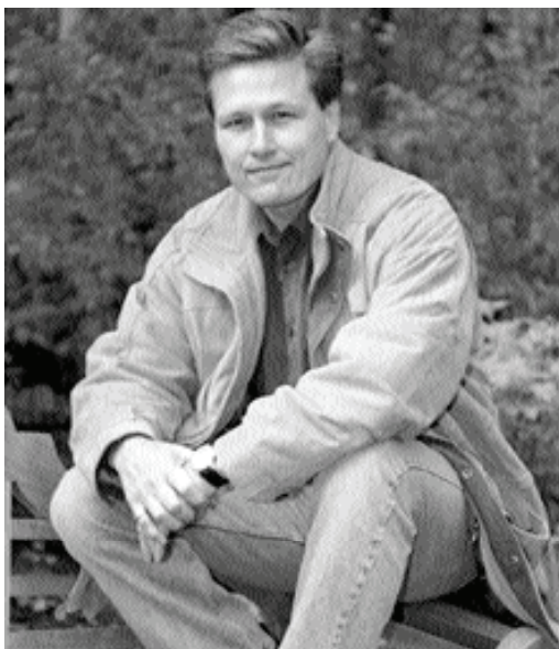
Lo scrittore David Baldacci

Del resto Barga ha davvero di che essere orgogliosa di questo suo discendente illustre che in dodici anni ha pubblicato 17 libri di successo mondiale.