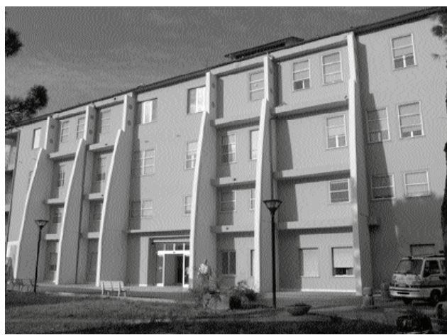
L'Ospedale "San Francesco" di Barga

Nel corso del 2007 a Barga le donazioni sono state 2.627, con un incremento di 69 donazioni rispetto ad una base già buona di 2.558 donazioni dell'anno precedente.