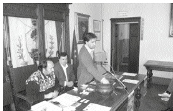
L'estrazione dei gironi

Per la fase nazionale giovedì 24 aprile allo stadio del Ciocco la prima classificata della fase regionale gruppo B incontrerà il GS Cuiopelli Capiano. La perdente di questa gara incontrerà di seguito la Lazio che poi giocherà ancora contro la vincente della prima partita. Allo stadio Mo-