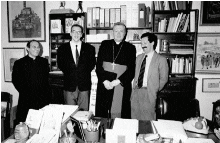
Visita pastorale del 1988. Don Piero accompagna il Vescovo mons. Alessandro Plotti durante un incontro presso la nostra redazione.

BARGA - Per il prossimo 30 aprile, primo anniversario della morte di Mons. Piero Giannini, Barga si sta preparando per una giornata di ricordo dell'indimenticabile Proposto.