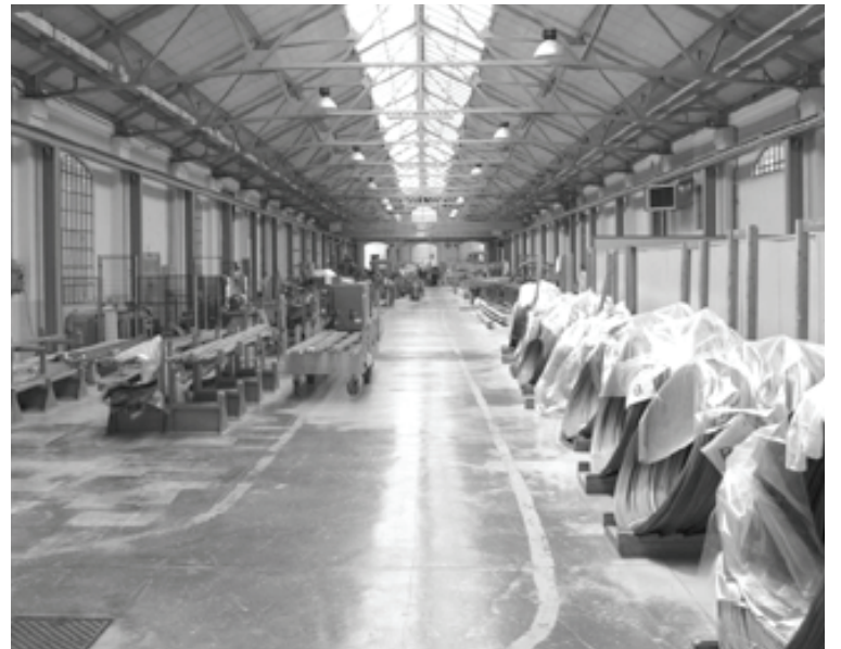
Un'immagine dello stabilimento Luvata di Fornaci di Barga