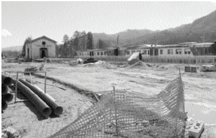
Un'immagine del cantiere dei lavori alla stazione di Fornaci