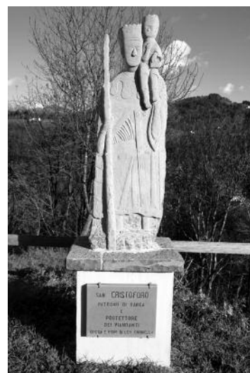
La statua di San Cristoforo collocata all'esterno della chiesina delle Palmente