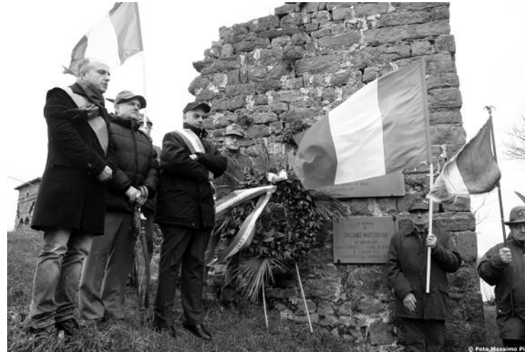
un momento delle celebrazioni