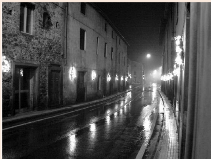
Luci di Natale a Ponte all'Ania

BARGA - Tra le notizie riguardanti le festività natalizie che troverete all'interno di questo numero, voglio proporvi anche alcune riflessioni sugli addobbi natalizi che si sono visti a Barga e negli altri paesi del comune nelle settimane scorse.