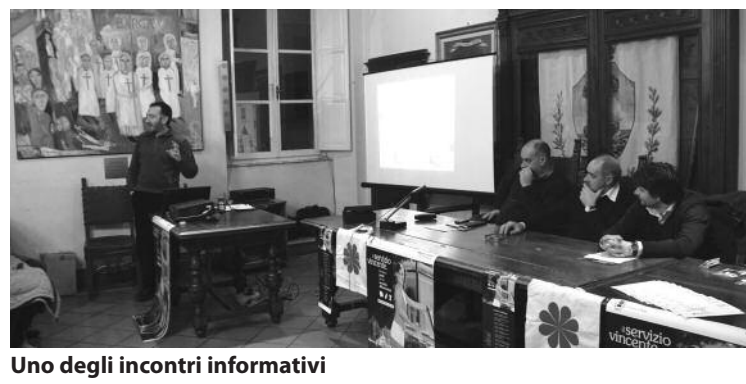
Uno degli incontri informativi