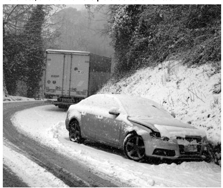
Nella foto, uno dei momenti più critici della nevicata

Altri interventi hanno riguardato il comprensorio di bonifica con il ricentrimento dell'alveo del torrente Corsonna nel comune di Barga in località La Mochia.