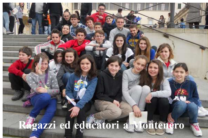
Ragazzi ed educatori a Montenero