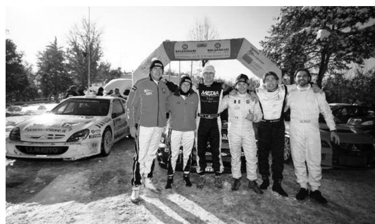
Il podio dei vincitori dell'edizione 2009

Due le tappe in programma. Con la prima che prenderà il via sabato 18 dicembre alle ore 9.31, verranno disputate sei prove speciali (Colle e Laghetto, da ripetere tre volte), al termine delle quali un riordino introdurrà alla