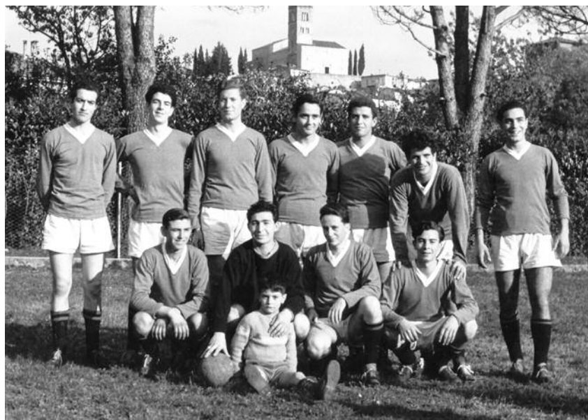
1955-1956: si riorganizza la squadra di calcio del Barga che torna a chiamarsi AS Barga e si iscrive al campionato di lega Giovanile e Centro Sportivo Italiano (CSI)