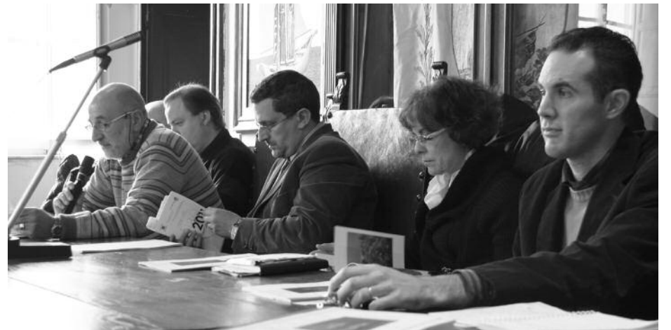
Un momento della presentazione del volume

BARGA – Il 30 novembre è ormai da anni celebrata nella nostra Regione la "Festa della Toscana", una festa istituita per ricordare che il 30 novembre 1786 il granduca Pietro Leopoldo, capo del Granducato di Toscana, abolì la pena di morte rendendo la Toscana il primo stato nel mondo a rifiutare la pena capitale.