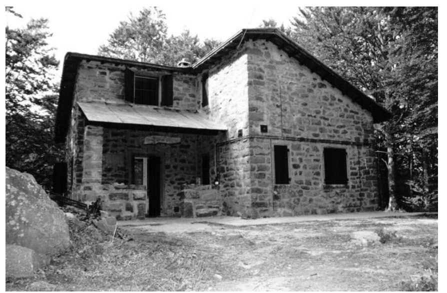
Il rifugio Bertagni al Lago Santo

Per quanto riguarda invece le uscite, è prevista una voce di 20.000