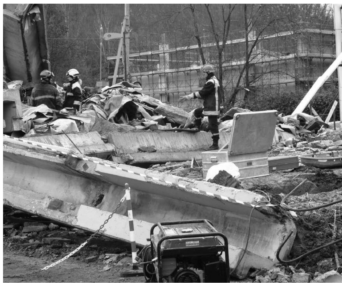
La squadra di ricerca e recupero francese impegnata nella working area di Fornaci di Barga

Sono stati centinaia gli uomini e tantissimi anche i mezzi impegnati nelle simulazioni nel nostro territorio, dalle Forze dell'ordine, agli uomini della protezione Civile, ai volontari. Nei tre giorni di