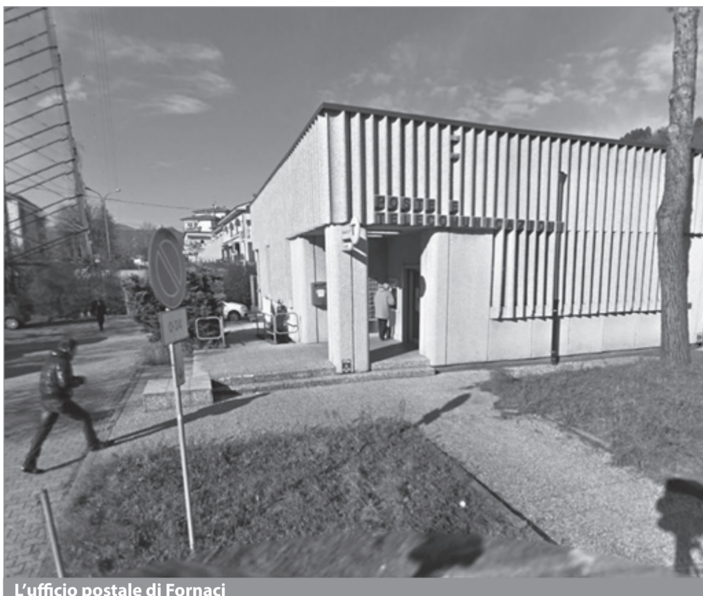
L'ufficio postale di Fornaci

Ecco, quello che più dà fastidio e non è accettabile è proprio la rassegnazione verso un disservizio - che, peraltro, tutti gli utenti pagano - da parte di un'azienda come Poste Italiane che, ancora, appartiene allo Stato e che, per di più, opera in regime di monopolio per molti dei suoi servizi. È possibile che l'Amministrazione comunale ed una rete associativa come "Fornaci 2.0" non riescano a far porre fine a questo disservizio pubblico magari anche at-