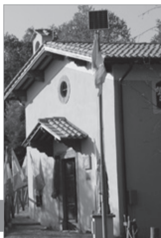
Il pannello solare per l'illuminazione della statua di San Cristoforo, donato dalla signora Caselli

Benfatto, cara signora Clotilde. Gli alpini, e tutti coloro che sono affezionati alla chiesina, ringraziano.