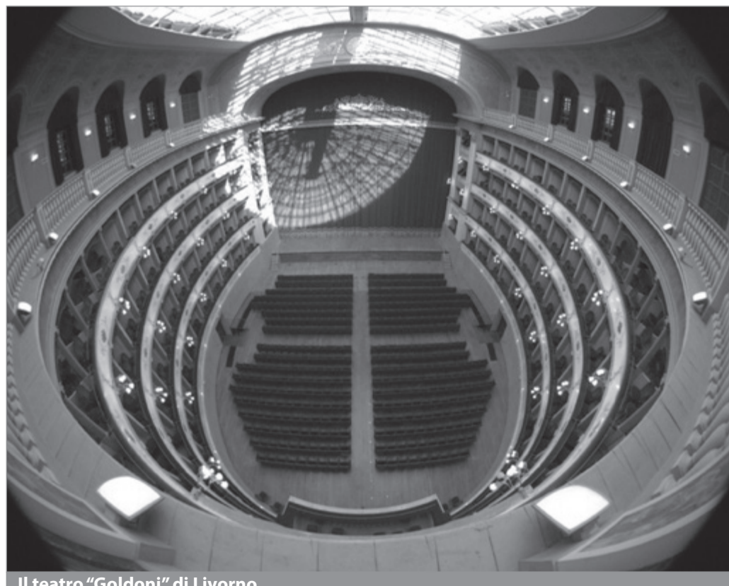
Il teatro "Goldoni" di Livorno