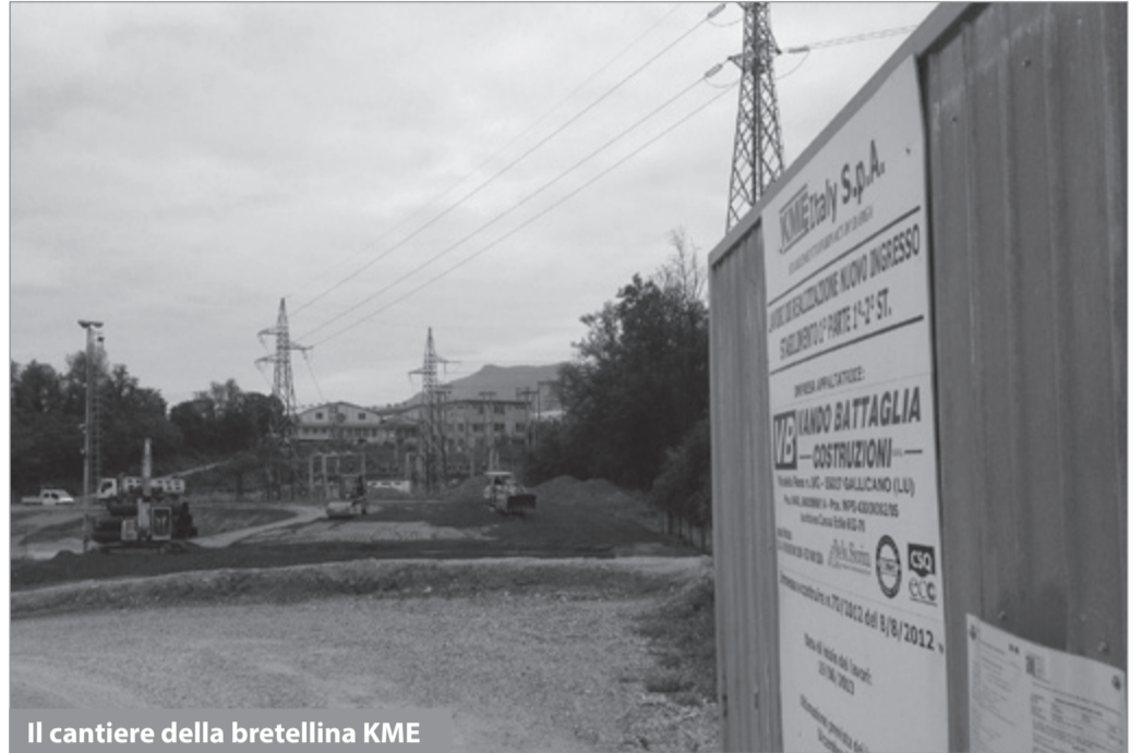
Il cantiere della bretellina KME

Il sindaco fa sapere che è anche in corso la gara, indetta dall'Unione dei Comuni per un importo di circa 60 mila euro, per la realizzazione della nuova viabilità di accesso e del nuovo parcheggio delle scuole di Filecchio, che risolverà l'annoso problema del traffico in entrata ed in uscita dalle due scuole del paese.