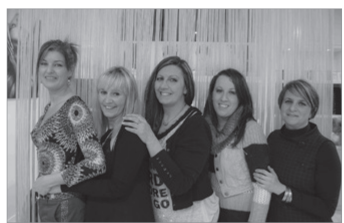
Sopra, lo staff di Blue Moon. Sotto, i nuovi locali

Se una donna si presenta nel tuo negozio con un'idea precisa, ma che non le si addice, preferisci consigliarla o assecondarla?