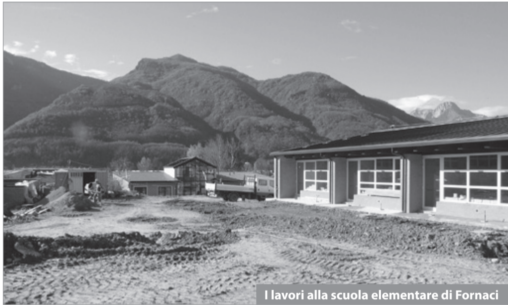
I lavori alla scuola elementare di Fornaci