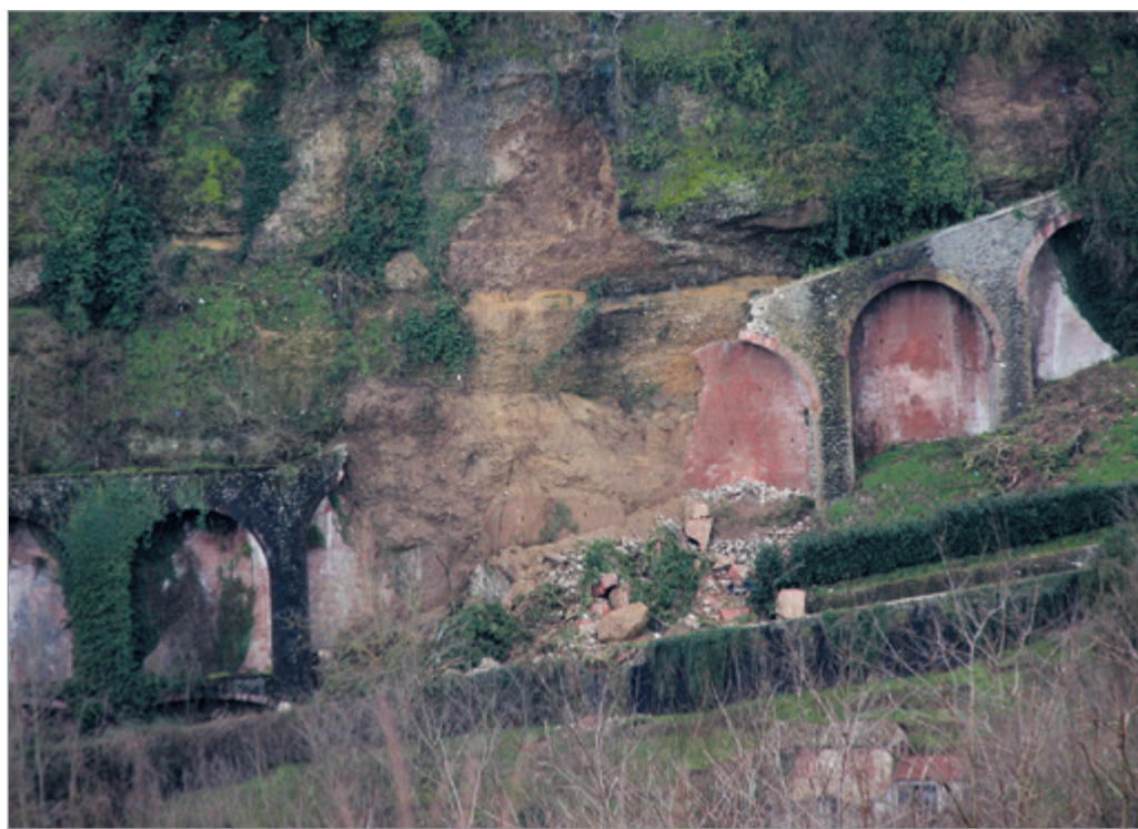
Le arcate crollate del muro della Ripa

Quindi il muraglione della Ripa dovrà essere ricostruito per continuare ad offrire protezione al colle dato anche la composizione del terreno della rupe che proprio negli strati inferiori è particolarmente friabile. Purtroppo, però, le stime parlano di una cifra che va dai 500mila al milione di euro.