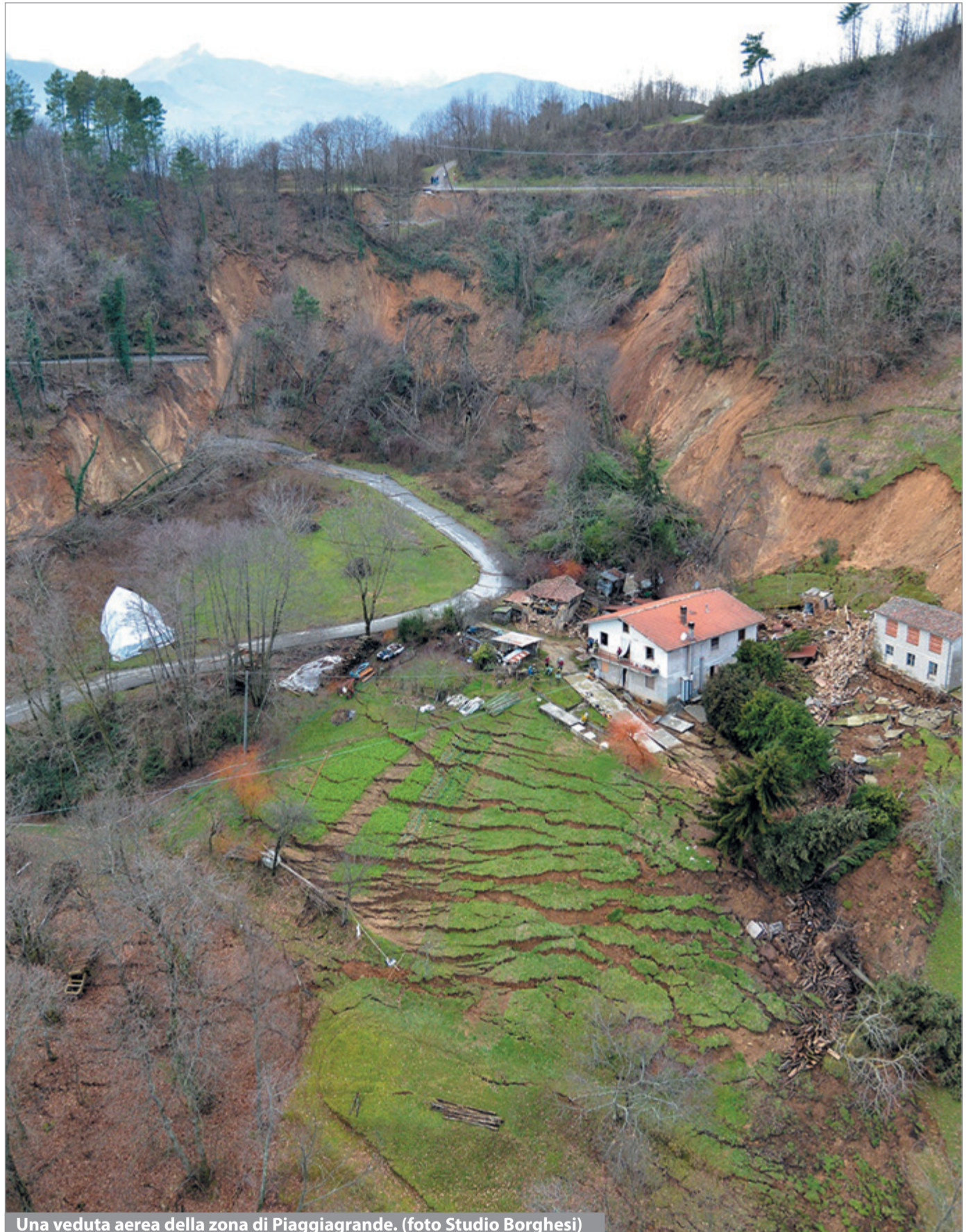
Una veduta aerea della zona di Piaggiagrande.

Piaggiagrande, per come erano abituati a vederla tutti gli abitanti della zona e tutti coloro che hanno utilizzato la vecchia strada di Renaio, non esiste più. Trasformata, ridisegnata, sconvolta, da una frana che sicuramente, come la pensano anche gli addetti ai lavori e le autorità presenti, ha dell'eccezionale in quanto a dimensioni e danni prodotti.