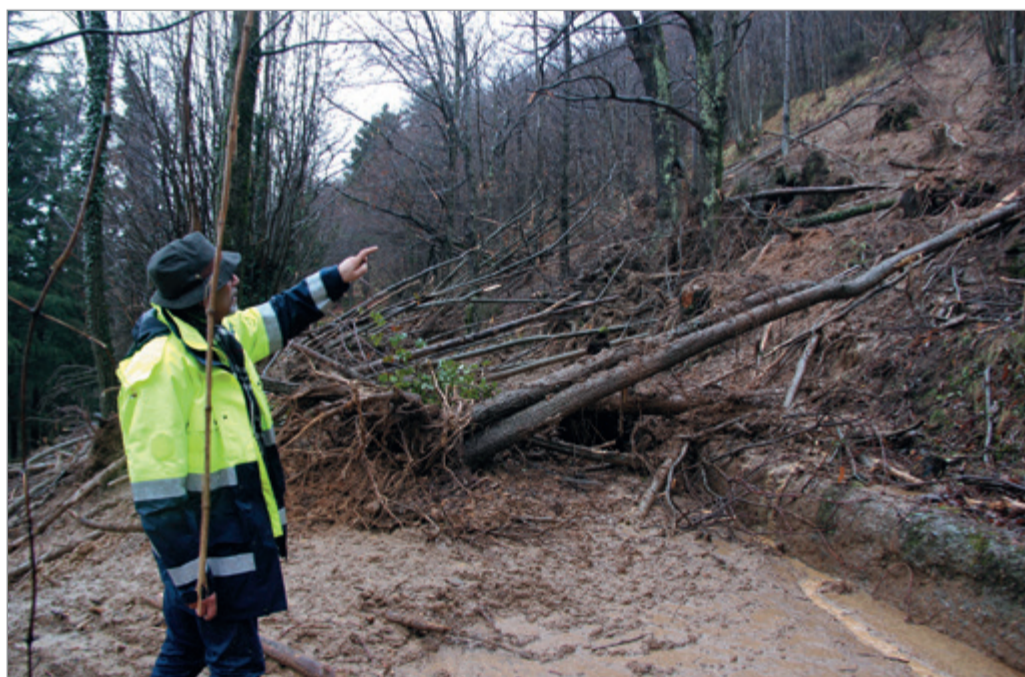
L'assessore Onesti sulla zona della frana