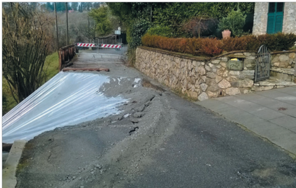
Nella colonna a fianco, sopralluoghi a Piaggiagrande e la frana avvenuta sotto il muro della Ripa. Qui sopra, i danni sulla strada di Albiano