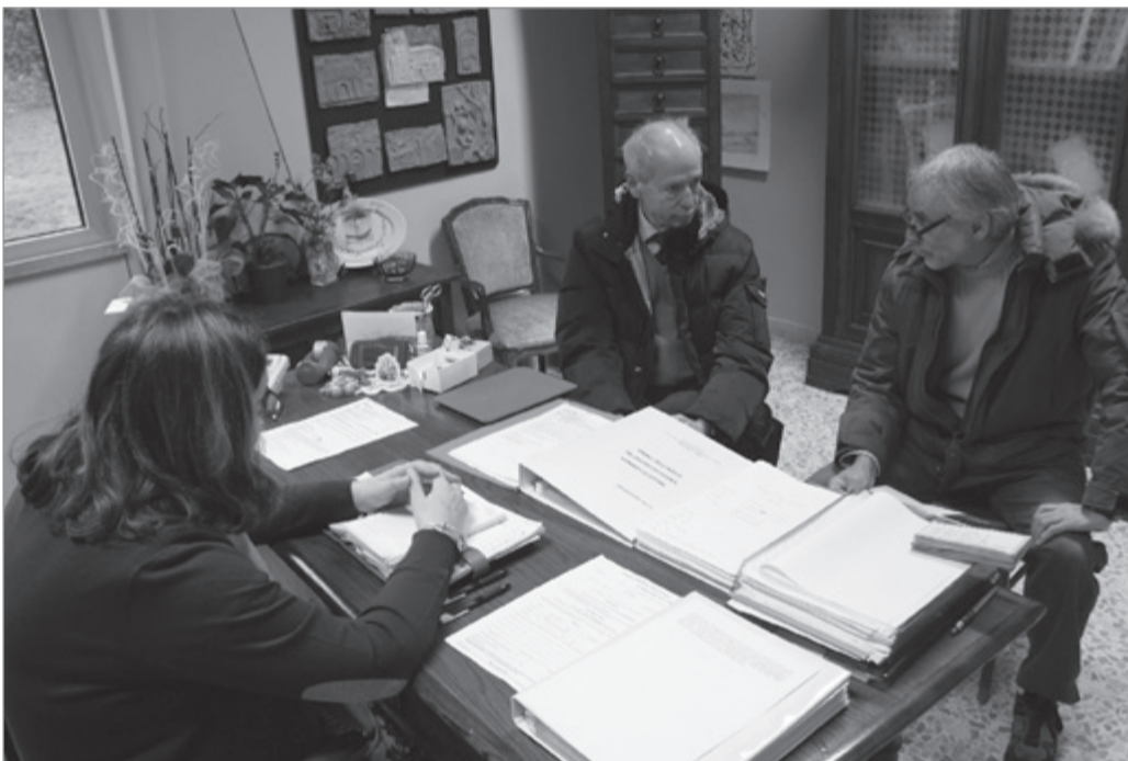
L'incontro fra la dirigente scolastica e la delegazione degli Amici del Cuore

BARGA – È stata ufficializzata nei giorni scorsi la nascita di una collaborazione attiva tra il gruppo Amici del Cuore Valle del Serchio (sodalizio impegnato nella lotta delle malattie cardiovascolari e alla loro prevenzione) e l'istituto comprensivo Giovanni Pascoli che riunisce scuole dell'infanzia, primarie e secondarie di primo grado del comune di Barga. L'intento è quello di portare avanti le lezioni di prevenzione già attivate negli anni scolastici scorsi