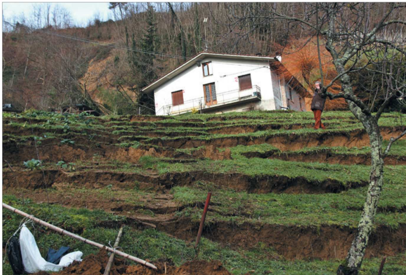
L'abitazione della famiglia Marchi gravemente colpita

Non sarebbe cosa sbagliata se da questa iniziativa spontanea potesse nascere un progetto per sostenere quei cittadini maggiormente coinvolti dai disastri naturali.